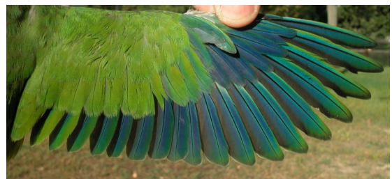
Cotorra argentina. Juvenil: diseño del ala (08-VIII).