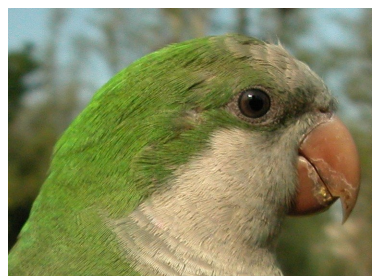
Cotorra argentina. Diseño de la cabeza: arriba adulto (21-IV); abajo juvenil (08-VIII).