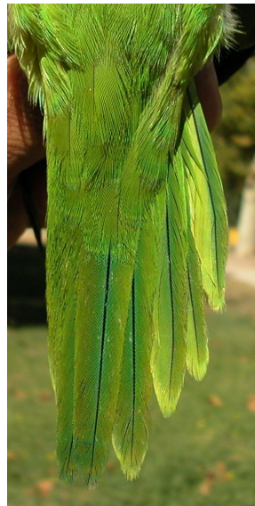
Cotorra argentina. Diseño de la cola: izquierda adulto (21-IV); derecha juvenil (08-VIII).