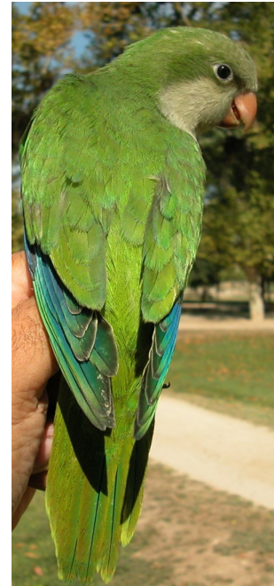
Cotorra argentina. Diseño del dorso: izquierda adulto (21-IV); derecha juvenil (08-VIII).