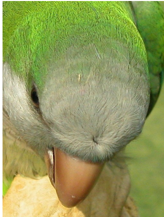
Cotorra argentina. Diseño de la frente: arriba adulto (21-IV); abajo juvenil (08-VIII).