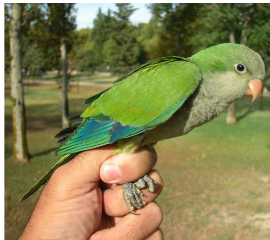
Cotorra argentina. Juvenil (08-VIII).