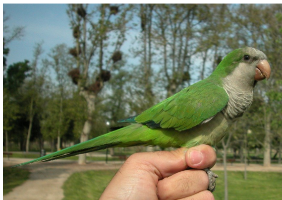
Cotorra argentina. Adulto (21-IV).