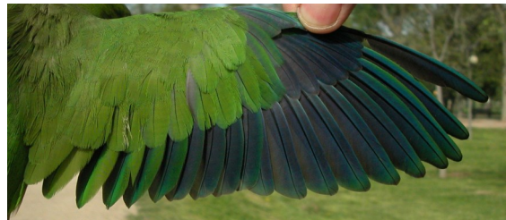
Cotorra argentina. Adulto: diseño del ala (21-IV).