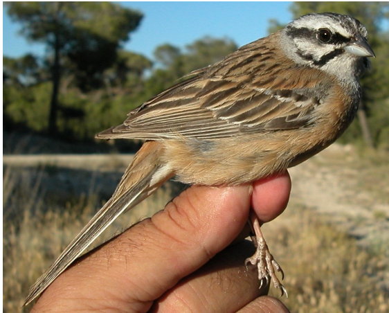
Escribano montesino. Verano. Adulto. Macho (18-VI).