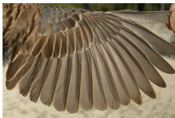
Escribano montesino. Verano. Adulto. Hembra: dise- ño del ala (21-V).