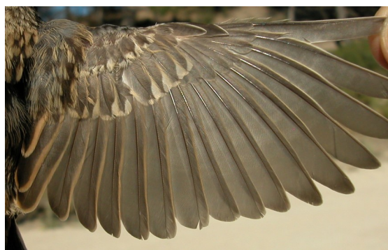
Escribano montesino. Verano. Juvenil: diseño del ala (27-VI).