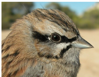
Escribano montesino. Otoño. 1º año. Diseño de la cabeza: arriba macho (12-X); abajo hembra (12-X).