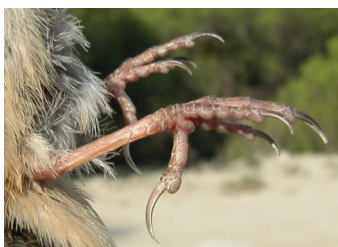
Escribano monte- sino. Color de las patas: arriba adulto (02-VI); abajo juvenil (18-VII).