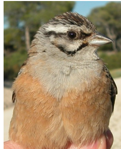
Escribano montesino. Verano. Adulto. Diseño del pecho: izquierda macho (18-VI); derecha hembra (21-V).