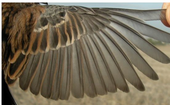
Escribano montesino. Otoño. Adulto. Hembra: diseño del ala (01-XI).