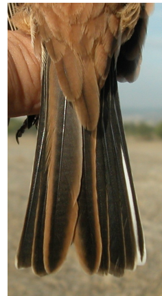
Escribano montesino. Otoño. Adulto. Diseño y desgaste de la cola: izquierda macho (12-XI); derecha hembra (01-XI).