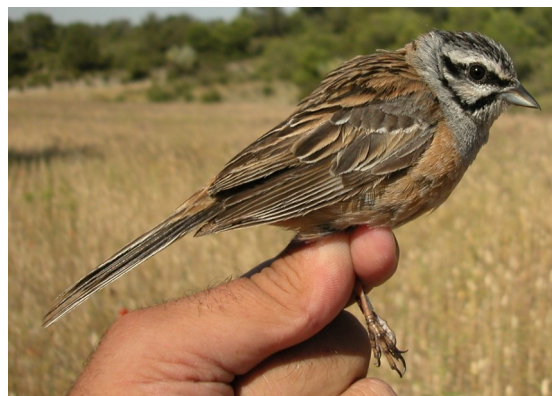
Escribano montesino. Verano. 2º año. Macho (12-VI).