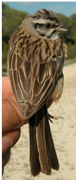
Escribano montesino. Verano. Adulto. Diseño del dorso: izquierda macho (18-VI); derecha hembra (21-V).