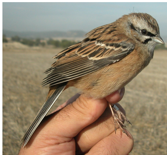
Escribano montesino. Otoño. Adulto. Hembra (01-XI).