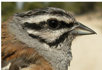
Escribano montesino. Adulto. Diseño de la cabeza y dorso.

15-16 cm. Adultos con dorso pardo listado de negro; partes inferiores ocre; cabeza gris listada de negro en capirote y mejillas, más intensamente en el macho ; pico azulado. Juveniles pardos, con moteado en partes inferiores grises; pequeñas coberteras alares de color gris.