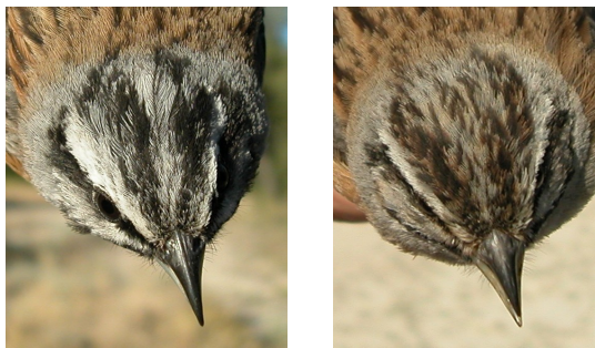
Escribano montesino. Verano. Determinación del sexo. Diseño del capirote: izquierda macho; derecha hembra.

Macho con las listas de la cabeza de color negro; centro del píleo gris puro con sólo un fino listado oscuro; ala mayor de 80 mm. Hembra con las listas de la cabeza de color pardo-negro o pardo-gis; centro del píleo gris o pardo-gris, habitualmente con un listado intenso; ala menor de 78 mm. Los juveniles no se pueden sexar utilizando el plumaje. CUIDADO: algunas hembras tienen el diseño de la cabeza bien marcado; algunos machos de 1º año son bastante iguales a las hembras adultas , aunque separables por la edad. En otoño el diseño de la cabeza está muy poco definido y no es siempre un carácter útil para determinar el sexo.