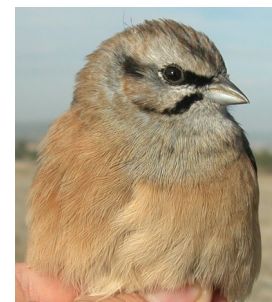
Escribano montesino. Otoño. Adulto. Diseño del pecho: izquierda macho (12-XI); derecha hembra (01-XI).