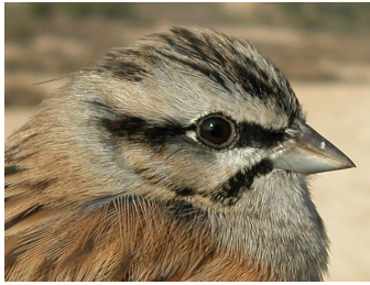
Escribano montesino. Otoño. Adulto. Diseño de la cabeza: arriba macho (12-XI); abajo hembra (01-XI).