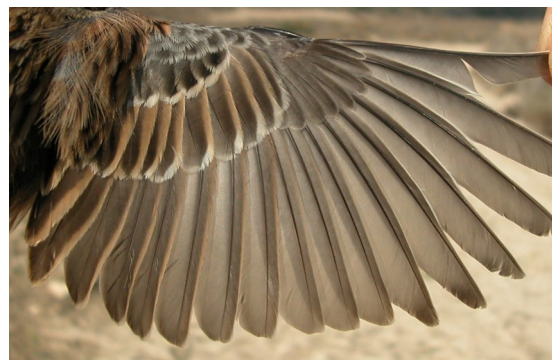
Escribano montesino. Otoño. Adulto. Macho: diseño del ala (12-XI).