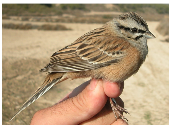
Escribano montesino. Otoño. Adulto. Macho (12-XI).