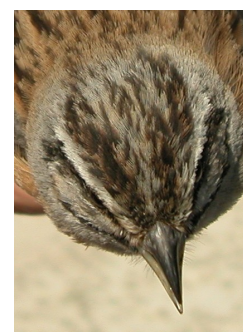
Escribano montesino. Verano. Adulto. Diseño del capirote: izquierda macho (18-VI); derecha hembra (21-V).