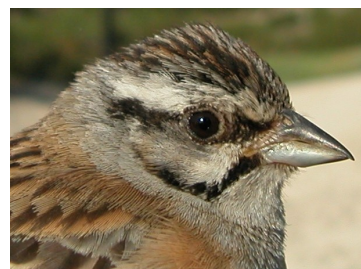
Escribano montesino. Verano. Determinación de la edad. Diseño de la cabeza: arriba adulto hembra; abajo juvenil.

Adulto con las plumas del ala sin límites de muda; 4ª pluma de la cola con punta blanca; plumas de la cola no mudadas con punta redondeada.