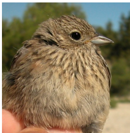
Escribano montesino. Verano. Diseño del pecho: arriba izquierda 2º año macho (12-VI); arriba derecha 2º año hembra (27-VI); izquier- da juvenil (27-VI).