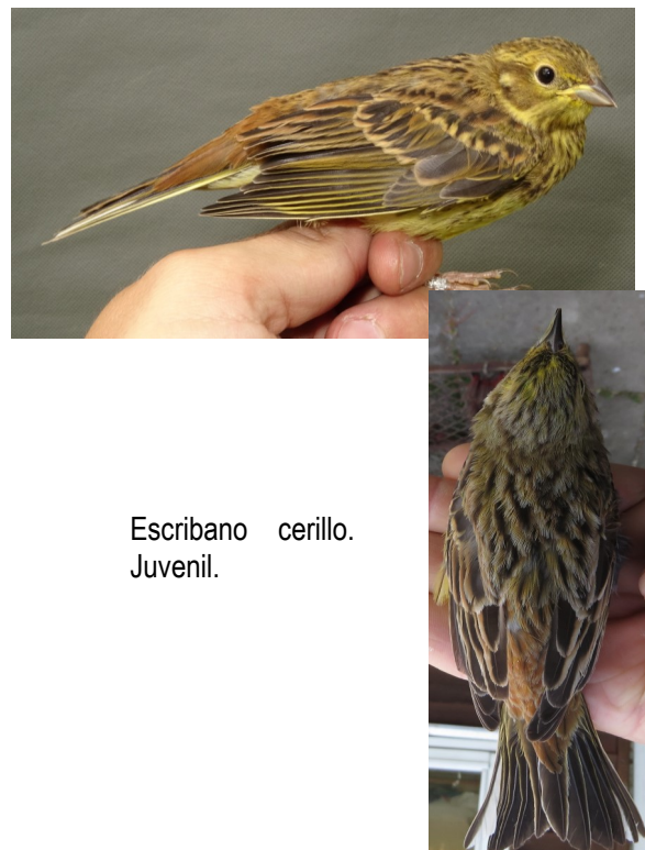
Escribano cerillo. Juvenil.