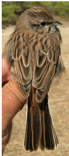
Escribano montesino. Otoño. 1º año. Diseño del dorso: izquierda macho (12-X); derecha hembra (12-X).