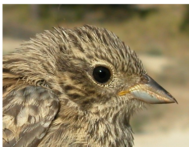
Escribano montesino. Verano. Diseño de la cabeza: arriba 2º año macho (12-VI); centro 2º año hembra (27-VI); abajo juvenil (27-VI).