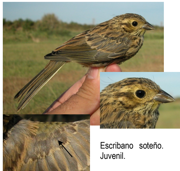
Escribano soteño. Juvenil.

El diseño de la cabeza hace inconfundible esta especie entre los demás escribanos adultos. Los juveniles son parecidos a los del escribano soteño , que tienen verdosas las pequeñas coberteras del ala; los del escribano cerillo tienen obispillo castaño; los del escribano hortelano tienen la garganta y pecho de color pardo-amarillento; el triguero es de mayor tamaño (16-19 mm.) y sin blanco en las plumas externas de la cola.