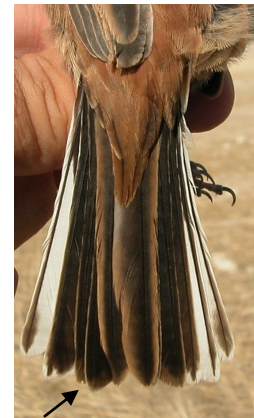
Escribano montesino. Otoño. 1º año. Diseño y desgaste de la cola: izquierda macho (12-X); derecha hembra (12-X).