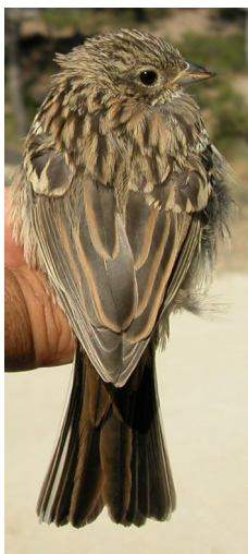
Escribano montesino. Verano. Diseño del dorso: arriba izquierda 2º año macho (12-VI); arriba derecha 2º año hembra (27-VI); iz- quierda juvenil (27-VI).