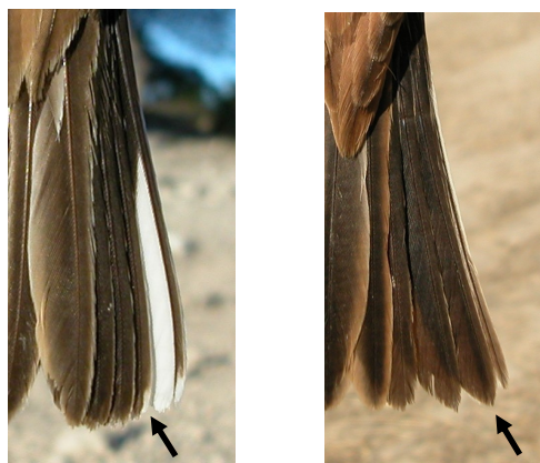
Escribano montesino. Determinación de la edad. Diseño de la 4ª pluma de la cola: izquierda adulto; derecha 1º año.