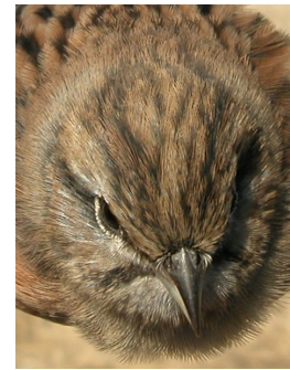
Escribano montesino. Otoño. 1º año. Diseño del capirote: izquierda macho (12-X); derecha hembra (12-X).