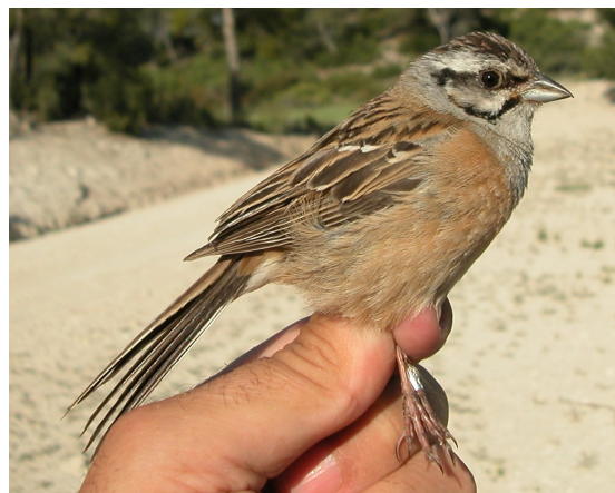
Escribano montesino. Verano. Adulto. Hembra (21-V).