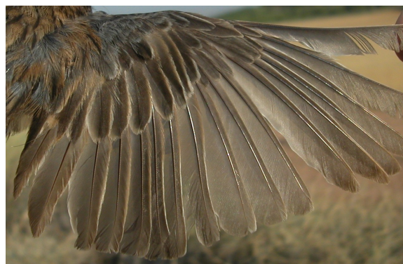
Escribano montesino. Verano. 2º año. Macho: diseño del ala (12-VI).