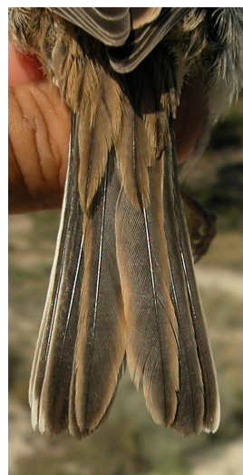
Escribano montesino. Verano. Diseño de la cola: arriba izquierda 2º año macho (12-VI); arriba derecha 2º año hembra (27-VI); iz- quierda juvenil (27-VI).