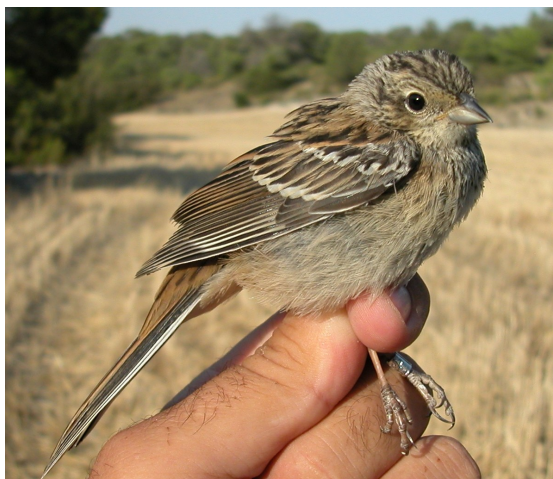
Escribano montesino. Verano. Juvenil (14-VII).