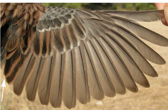
Escribano montesino. Otoño. 1º año. Hembra: diseño del ala (12-X).