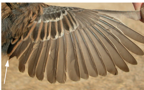
Escribano montesino. Otoño. 1º año. Macho: diseño del ala (12-X).