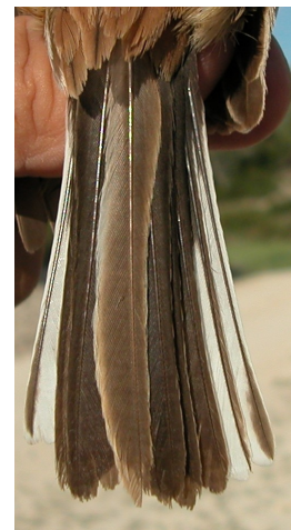
Escribano montesino. Verano. Adulto. Diseño de la cola: izquierda macho (18-VI); derecha hembra (21-V).