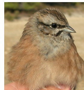
Escribano montesino. Otoño. 1º año. Diseño del pecho: izquierda macho (12-X); derecha hembra (12-X).