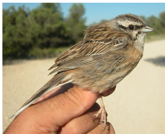
Escribano montesino. Verano. 2º año. Hembra (27-VI).