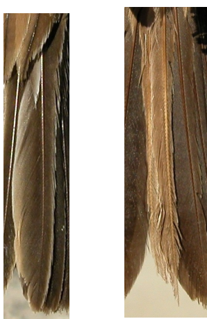
Escribano montesino. Verano. Determinación de la edad. Desgaste de la pluma central de la cola: izquierda adulto; derecha 2º año.