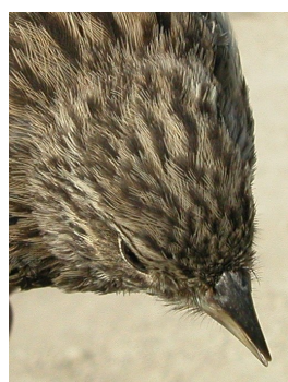
Escribano montesino. Verano. Diseño del capirote: arriba izquierda 2º año macho (12-VI); arriba derecha 2º año hembra (27-VI); izquierda juvenil (27-VI).