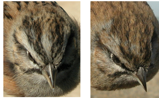
Escribano montesino. Invierno. Determinación del sexo. Diseño del capirote: izquierda macho; derecha hembra.