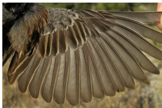
Escribano montesino. Verano. Adulto. Macho: diseño del ala (18-VI).