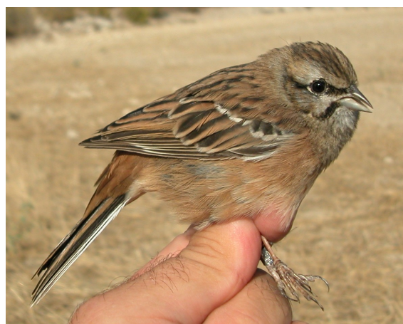
Escribano montesino. Otoño. 1º año. Hembra (12-X).