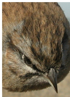
Escribano montesino. Otoño. Adulto. Diseño del capirote: izquierda macho (12-XI); derecha hembra (01-XI).