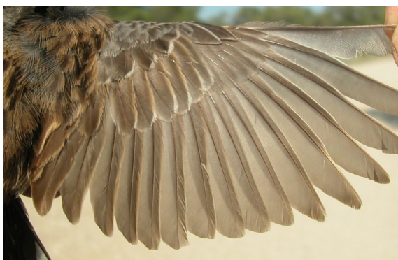
Escribano montesino. Verano. 2º año. Hembra: diseño del ala (27-VI).