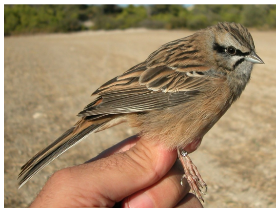
Escribano montesino. Otoño. 1º año. Macho (12-X).