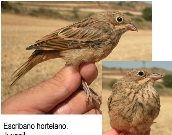
Escribano hortelano. Juvenil.