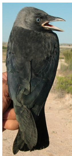
Grajilla. Diseño del dorso: arriba izquierda adulto (28-V); arriba derecha 2º año (11-III); izquierda juvenil (28-VI).