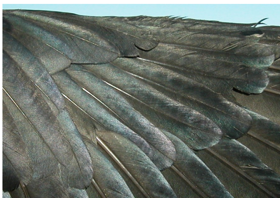
Grajilla. Adulto: diseño del álula (27-IV).