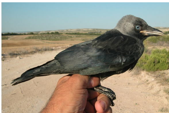
Grajilla. Juvenil (28-VI).