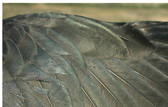
Grajilla. Juvenil: diseño del álula (28-VI).