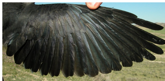
Grajilla. Adulto: diseño del ala (27-IV).