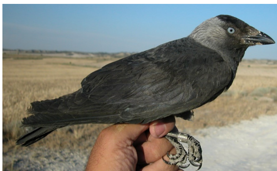
Grajilla. Adulto (28-V).