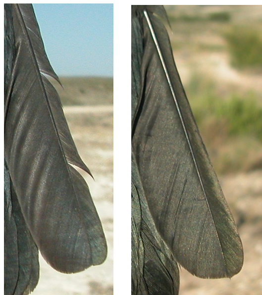
Grajilla. Determinación de la edad. Diseño de la punta de la pluma más externa de la cola: izquierda adulto; derecha juvenil.