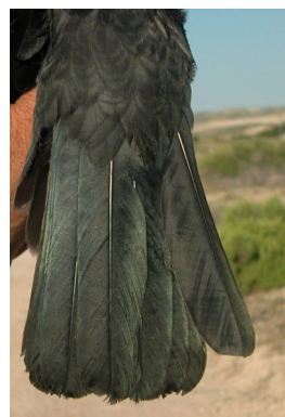
Grajilla. Desgaste de la cola y diseño de la pluma más externa: arriba izquierda adulto (28-V); arriba derecha 2º año (11-III); izquierda juvenil (28-VI).