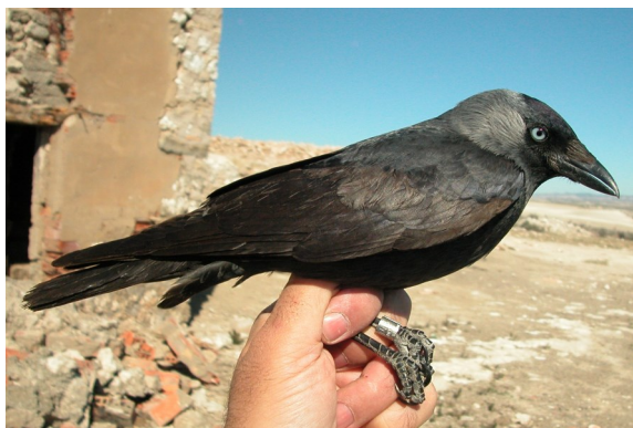
Grajilla. 2º año (11-III).