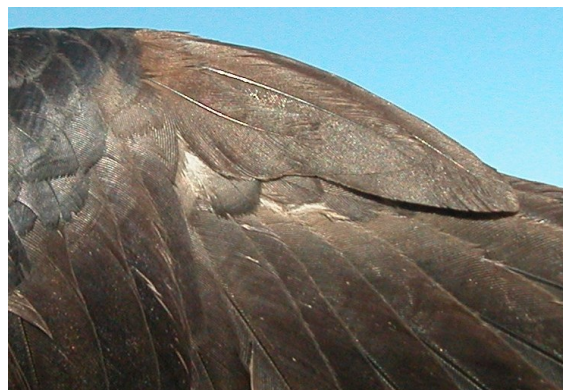
Grajilla. 2º año: diseño del álula (11-III).