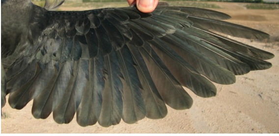
Grajilla. Juvenil: diseño del ala (28-VI).