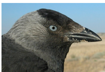
Grajilla. Diseño de la cabeza y cuello

30-31 cm. Plumaje de color negro, con parte superior de la cabeza y cuello grises; pico y patas negras.