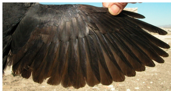
Grajilla. 2º año: diseño del ala (11-III).