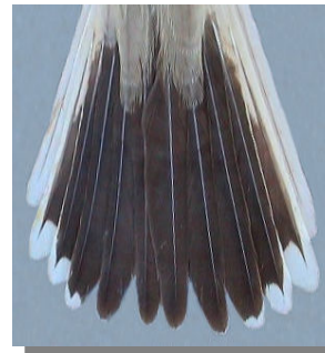
Alcaudón chico. Primavera. Diseño de la cola: arriba izquierda macho (05-V) (Foto: Reinhard Vohwinkel); arriba derecha hembra (11-VII); izquierda juvenil (25-VIII) (Foto: Reinhard Vohwinkel).