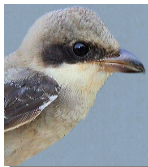
Alcaudón chico. Primavera. Diseño del pecho: arriba izquierda macho (05-V) (Foto: Reinhard Vohwinkel); arriba derecha hembra (11-VII); izquierda juvenil (25-VIII) (Foto: Reinhard Vohwinkel).