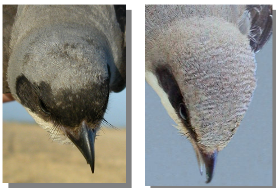
Alcaudón chico. Determinación de la edad. Diseño de la frente: izquierda adulto hembra; derecha juvenil.