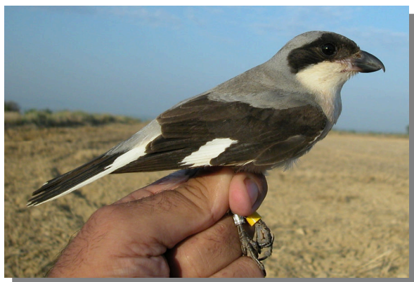
Alcaudón chico. Primavera. Adulto. Hembra (11-VII).