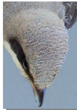
Alcaudón chico. Primavera. Diseño del píleo: arriba izquierda macho (05-V) (Foto: Reinhard Vohwinkel); arriba derecha hembra (11-VII); izquierda juvenil (25-VIII) (Foto: Reinhard Vohwinkel).