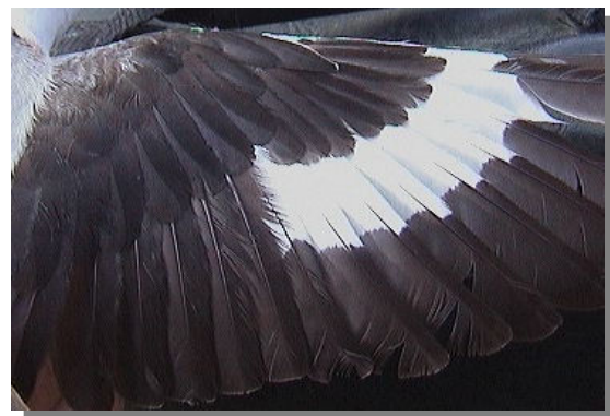
Alcaudón chico. Primavera. Adulto. Macho: diseño del ala (05-V).