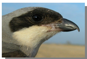
Alcaudón chico. Diseño del ala, cabeza y frente.