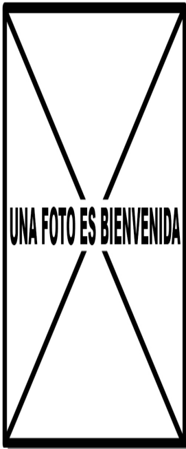
Alcaudón chico. Primavera. Diseño del dorso: arriba izquierda macho (); arriba derecha hembra (11-VII); izquierda juvenil ()