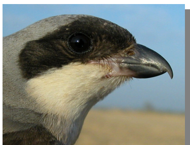
Alcaudón chico. Primavera. Diseño de la cabeza: arriba macho (05-V) (Foto: Reinhard Vohwinkel); centro hembra (11-VII); abajo juvenil (25-VIII) (Foto: Reinhard Vohwinkel).