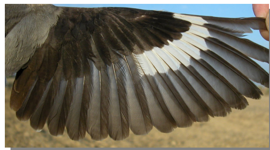
Alcaudón chico. Primavera. Adulto. Hembra: diseño del ala (11-VII).