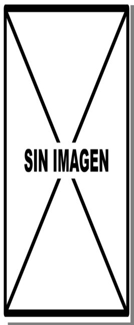
Alcaudón chico. Determinación de la edad. Diseño del dorso: izquierda adulto hembra; derecha juvenil.