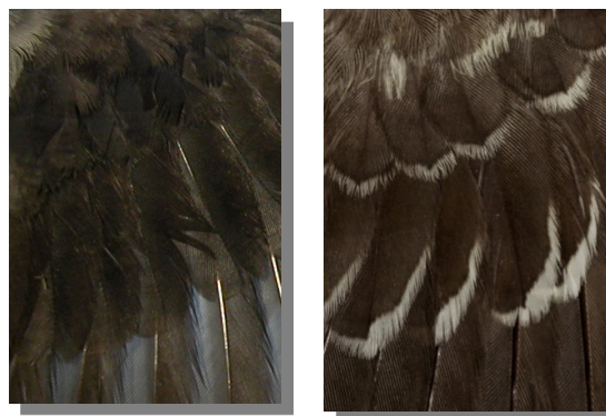
Alcaudón chico. Determinación de la edad. Diseño de coberteras del ala: izquierda adulto; derecha juvenil.

Adulto con plumaje desgastado; manto sin barrado, de color gris uniforme; con una banda negra en la frente; lados del pecho y flancos sin barrado gris; grandes coberteras negro uniforme.