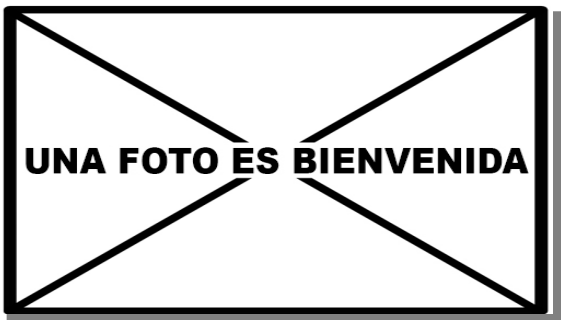
Alcaudón chico. Primavera. Juvenil ().