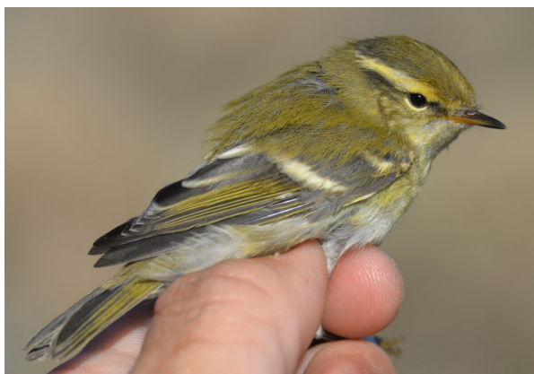
Mosquitero bilistado. Otoño. Adulto (11-X) (Foto: Pere Josa).