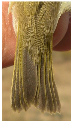
Mosquitero bilistado. Otoño. Diseño de la cola: izquierda adulto (11-X) (Foto: Pere Josa).