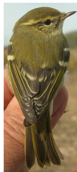
Mosquitero bilistado. Otoño. Edad. Diseño del dorso: izquierda adulto; derecha 1º año.