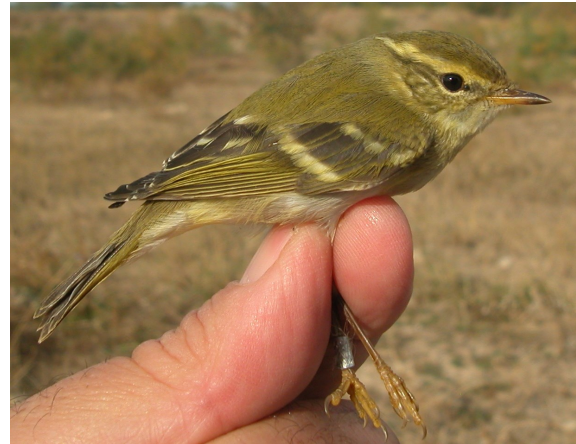
Mosquitero bilistado. Otoño. 1º año (28-X).

Muda postnupcial completa, habitualmente terminada en agosto. Muda postjuvenil parcial que abarca plumas corporales y a veces pequeñas y medianas coberteras y algunas plumas de la cola.