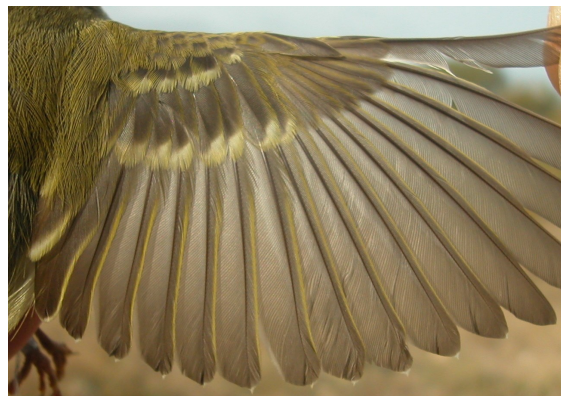
Mosquitero bilistado. Otoño. 1º año: diseño del ala (28-X).