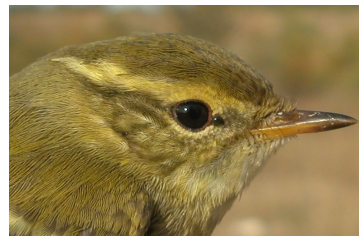
Mosquitero bilistado. Otoño. Diseño de la cabeza: arriba adulto (11-X); abajo 1º año (28-X).