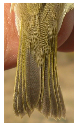
Mosquitero bilistado. Otoño. Edad. Diseño de la cola: izquierda adulto; derecha 1º año.