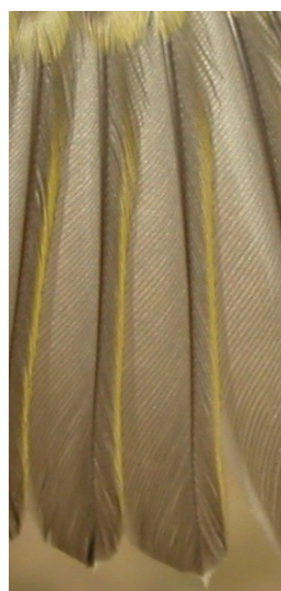
Mosquitero bilistado. Otoño. Edad. Diseño de secundarias: izquierda adulto; derecha 1º año.