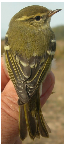
Mosquitero bilistado. Otoño. Diseño del dorso: izquierda adulto (08-XI); derecha 1º año (28-X).