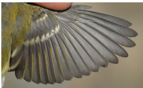
Mosquitero bilistado. Otoño. Adulto: diseño del ala (11-X).