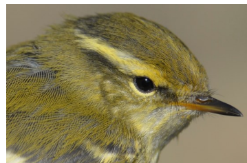
Mosquitero bilistado. Otoño. Diseño de la cabeza: arriba adulto (); abajo 1º año (28-X).