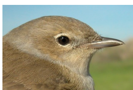
Curruca mosquitera. Diseño de cabeza y dorso.

13-14 cm. Especie sin caracteres llamativos, con plumaje pardo oliva en el dorso y más claro en las partes inferiores.