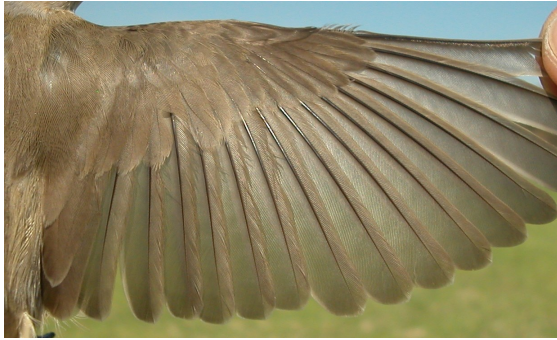
Curruca mosquitera. Primavera: diseño del ala (02-V).