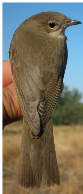
Curruca mosquitera. Diseño y desgaste del dorso: arriba izquierda en primavera (18-V); arriba derecha adulto en otoño (31-VIII); izquierda juvenil (13-VIII).