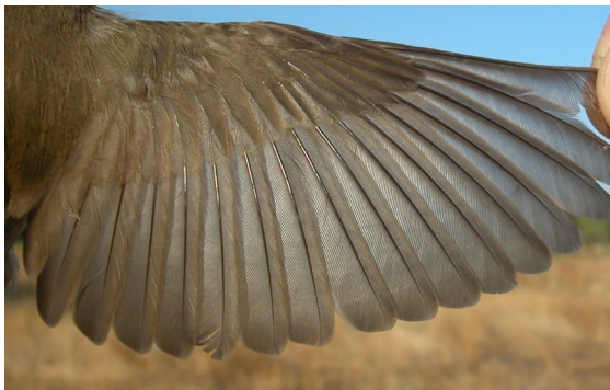
Curruca mosquitera. Otoño. Juvenil: diseño del ala (13-VIII).