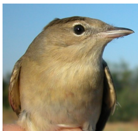
Curruca mosquitera. Diseño del pecho: arriba izquierda en primavera (02-V); arriba derecha adulto en otoño (31-VIII); izquierda juvenil (13-VIII).