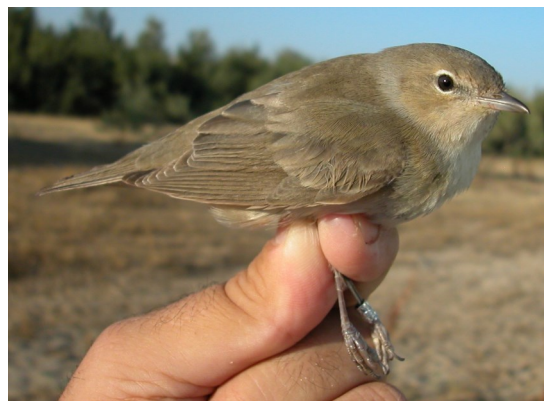
Curruca mosquitera. Otoño. Adulto (31-VIII).

■ Estival ■ Residente ■ Invernante ■ En paso