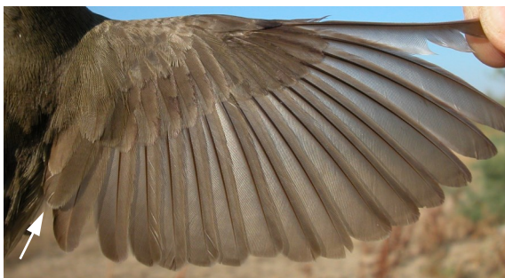
Curruca mosquitera. Otoño. Adulto: diseño del ala (31-VIII).