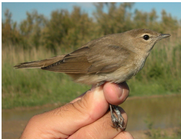
Curruca mosquitera. Primavera (18-V).