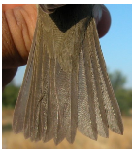
Curruca mosquitera. Diseño de la cola: arriba izquierda en primavera (02-V); arriba derecha adulto en otoño (31-VIII); izquierda juvenil (13-VIII).