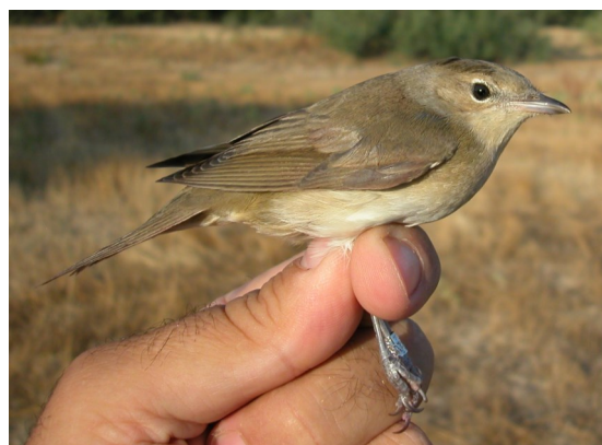
Curruca mosquitera. Otoño. Juvenil (13-VIII).