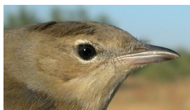
Curruca mosquitera. Diseño de la cabeza y color del iris: arriba izquierda en primavera (02-V); arriba derecha adulto en otoño (31-VIII); izquierda juvenil (13-VIII).