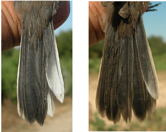
Curruca cabecinegra. Juvenil. Determinación del sexo. Diseño de la pluma externa de la cola: izquierda macho, derecha hembra.