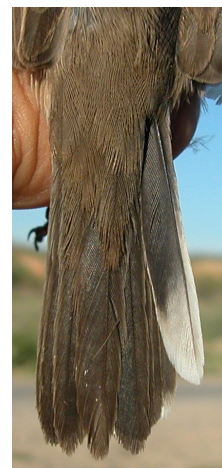
Curruca cabecinegra. Primavera. Adulto. Diseño de la cola: izquierda macho (06-V); derecha hembra (05-V).