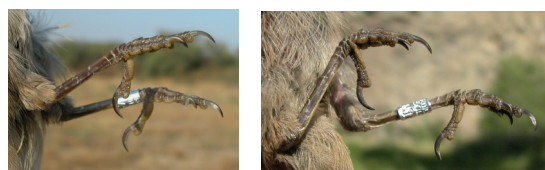
Curruca cabecinegra. Primavera. Color de las patas: izquierda adulto (15-IX); derecha juvenil (07-VII).