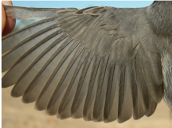
Curruca cabecinegra. Otoño. Adulto. Macho: diseño del ala (20-IX).