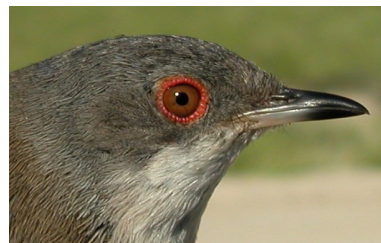
Curruca cabecinegra. Primavera. Adulto. Diseño de la cabeza: arriba macho (06-V); abajo hembra (05-V).