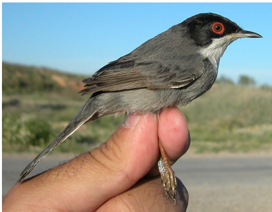
Curruca cabecinegra. Primavera. 2º año. Macho (05-V).