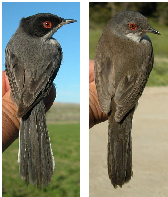
Curruca cabecinegra. Primavera. Adulto. Diseño del dorso: izquierda macho (06-V); derecha hembra (05-V).