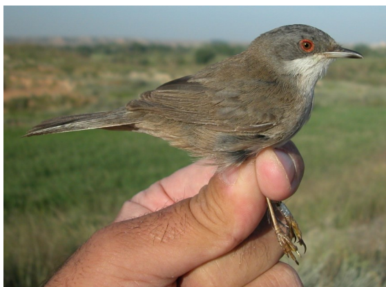
Curruca cabecinegra. Primavera. 2º año. Hembra (19-V).