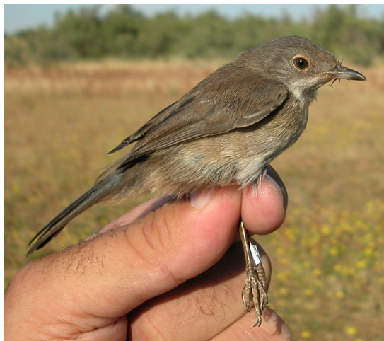
Curruca cabecinegra. Primavera. Juvenil. Hembra (06-VII).