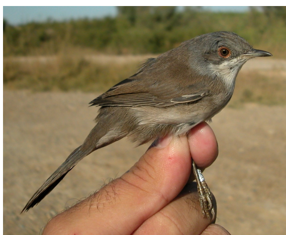
Curruca cabecinegra. Otoño. 1º año. Hembra (20-IX).

Curruca cabecinegra. Otoño. 1º año. Diseño de la cabeza: arriba macho (15-IX); abajo hembra (20-IX).