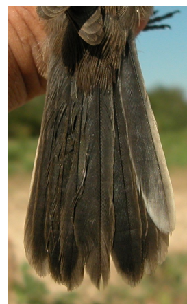
Curruca cabecinegra. Primavera. Juvenil. Diseño de la cola: izquierda macho (30-VI); derecha hembra (06-VII).