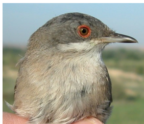
Curruca cabecinegra. Primavera. 2º año. Diseño del pecho: izquierda macho (05-V); derecha hembra (19-V).