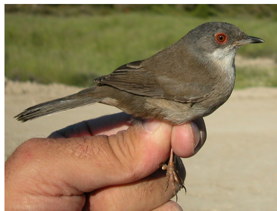
Curruca cabecinegra. Adulto. Hembra (05-V).

■ Estival ■ Residente ■ Invernante ■ En paso