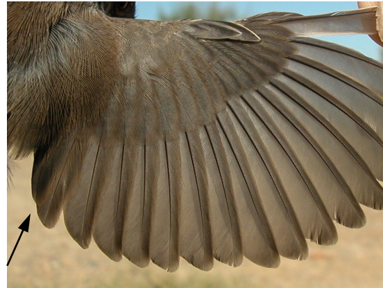
Curruca cabecinegra. Otoño. 1º año. Hembra: diseño del ala (20-IX).