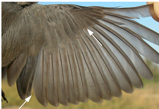
Curruca cabecinegra. Otoño. 1º año. Macho: diseño del ala (15-IX).