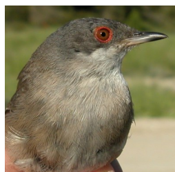
Curruca cabecinegra. Primavera. Adulto. Diseño del pecho: izquierda macho (06-V); derecha hembra (05-V).