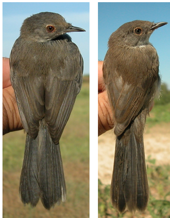
Curruca cabecinegra. Primavera. Juvenil. Diseño del dorso: izquierda macho (30-VI); derecha hembra (06-VII).