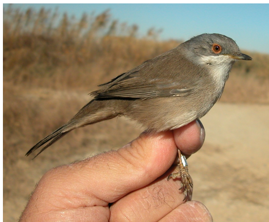
Curruca cabecinegra. Otoño. Adulto. Hembra (17-XI).