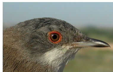
Curruca cabecinegra. Primavera. 2º año. Diseño de la cabeza: arriba macho (05-V); abajo hembra (19-V).