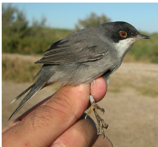
Curruca cabecinegra. Otoño. Adulto. Macho (20-IX).