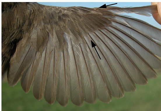
Curruca cabecinegra. Primavera. 2º año. Hembra: diseño del ala (19-V).