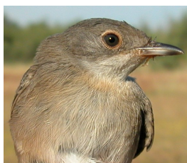
Curruca cabecinegra. Primavera. Juvenil. Diseño del pecho: izquierda macho (30-VI); derecha hembra (06-VII).