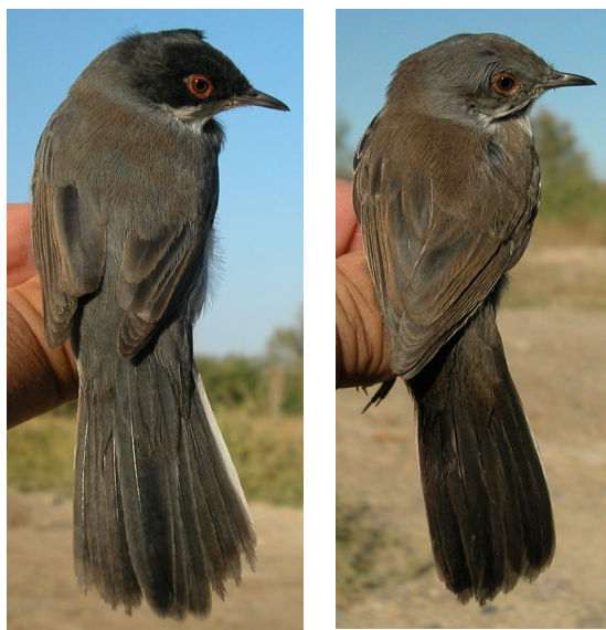
Curruca cabecinegra. Otoño. 1º año. Diseño del dorso: izquierda macho (15-IX); derecha hembra (20-IX).