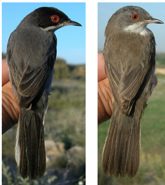
Curruca cabecinegra. Primavera. 2º año. Diseño del dorso: izquierda macho (05-V); derecha hembra (19-V).