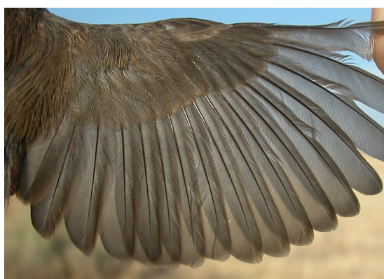
Curruca cabecinegra. Primavera. Juvenil. Hembra: diseño del ala (06-VII).