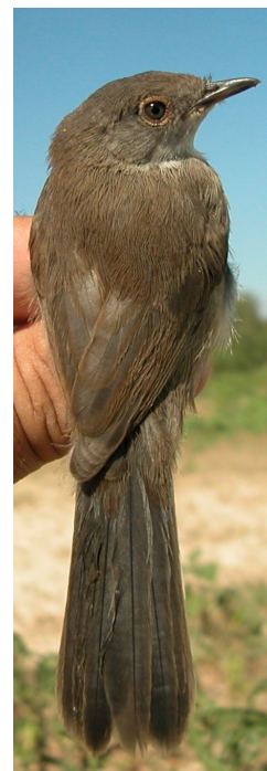
Curruca cabecinegra. Juvenil. Diseño del dorso, cabeza y longitud 10ª primaria.