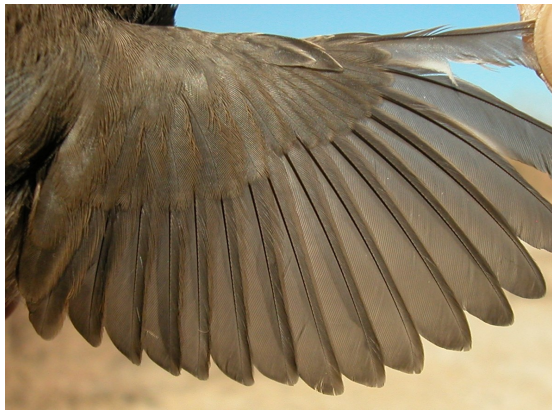
Curruca cabecinegra. Otoño. Adulto. Hembra: diseño del ala (17-XI).