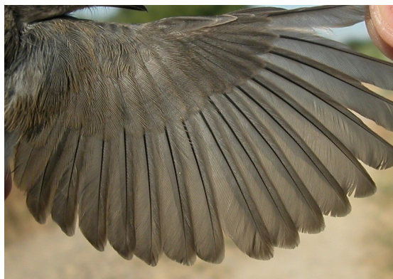
Curruca cabecinegra. Primavera. Juvenil. Macho: diseño del ala (30-VI).