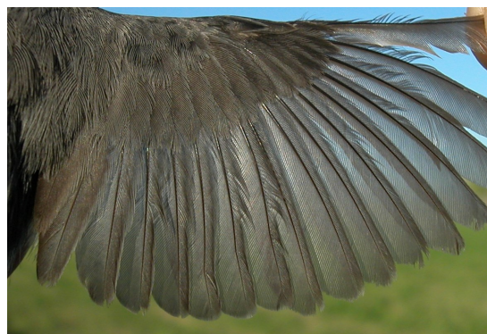
Curruca cabecinegra. Primavera. Adulto. Macho: diseño del ala (06-V).