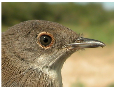
Curruca cabecinegra. Primavera. Juvenil. Diseño de la cabeza: arriba macho (30-VI); abajo hembra (06-VII).