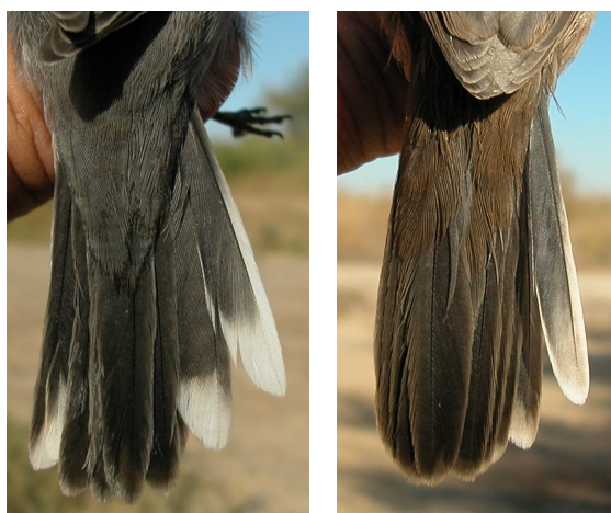
Curruca cabecinegra. Otoño. Adulto. Diseño de la cola: izquierda macho (20-IX); derecha hembra (17-XI).