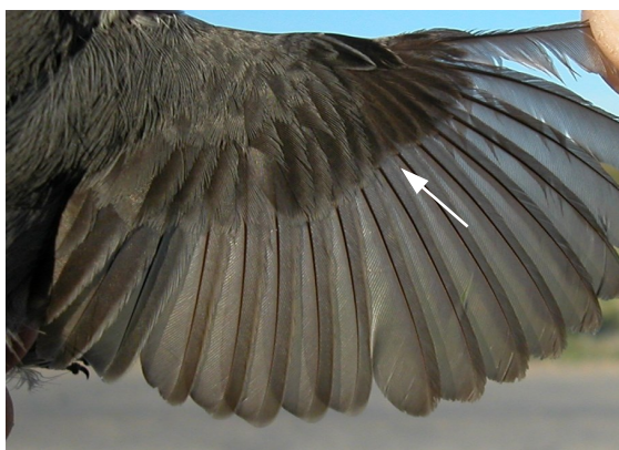
Curruca cabecinegra. Primavera. 2º año. Macho: diseño del ala (05-V).