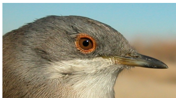
Curruca cabecinegra. Determinación de la edad. Diseño de la cabeza y color del iris: arriba adulto hembra, abajo juvenil.

CUIDADO: en primavera, después de la muda prenupcial, ambos tipos de edad muestran límites de muda en el ala, pero las aves que tuvieron muda postnupcial/postjuvenil completa tienen coberteras primarias y plumas de vuelo no cambiadas poco desgastadas y bastante grises.