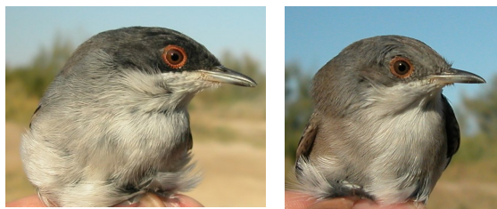
Curruca cabecinegra. Otoño. 1º año. Diseño del pecho: izquierda macho (15-IX); derecha hembra (20-IX).