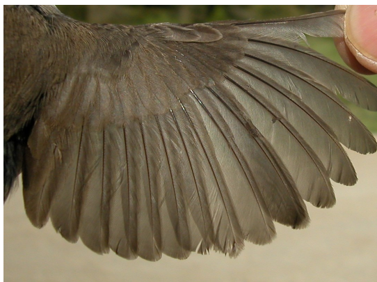
Curruca cabecinegra. Primavera. Adulto. Hembra: diseño del ala (05-V).