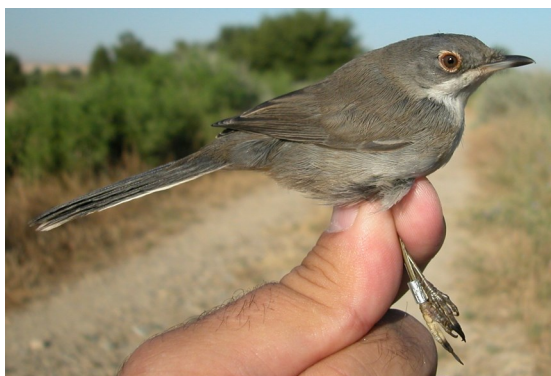
Curruca cabecinegra. Primavera. Juvenil. Macho (30-VI).