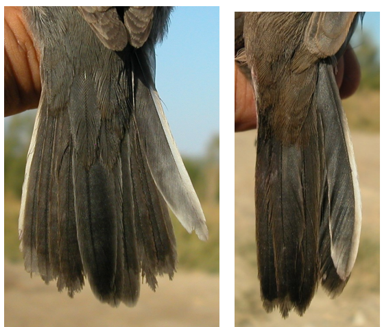
Curruca cabecinegra. Otoño. 1º año. Diseño de la cola: izquierda macho (15-IX); derecha hembra (20-IX).