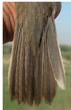
Curruca cabecinegra. Primavera. 2º año. Diseño de la cola: izquierda macho (05-V); derecha hembra (19-V).