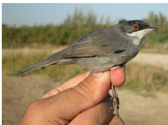
Curruca cabecinegra. Otoño. 1º año. Macho (15-IX).

Curruca cabecinegra. Otoño. Adulto. Diseño de la cabeza: arriba macho (20-IX); abajo hembra (17-XI).