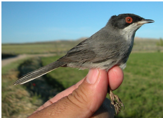
Curruca cabecinegra. Primavera. Adulto. Macho (06-V).