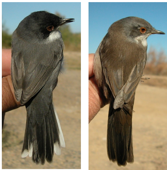
Curruca cabecinegra. Otoño. Adulto. Diseño del dorso: izquierda macho (20-IX); derecha hembra 17-XI).