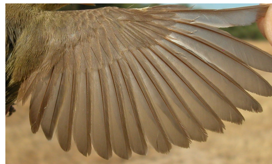
Zarcero polígnota. Otoño. Adulto: diseño del ala (20-VII).