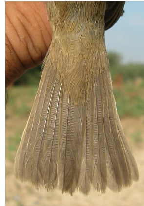
Zarcero polígnota. Desgaste de la cola: arriba izquierda en primavera (04-VI); arriba derecha adulto en otoño (14-VI); izquierda juvenil (20-VII).