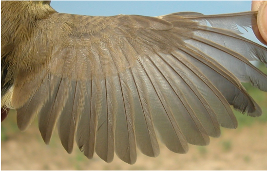
Zarcero polígloa. Otoño. Juvenil: diseño del ala (20-VI).