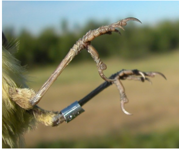
Zarcero polígnota. Color de las patas: arriba adulto (04-VI); abajo juvenil (07-VII).