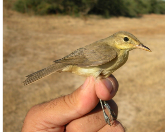
Zarcero políglota. Otoño. Juvenil (04-VII).