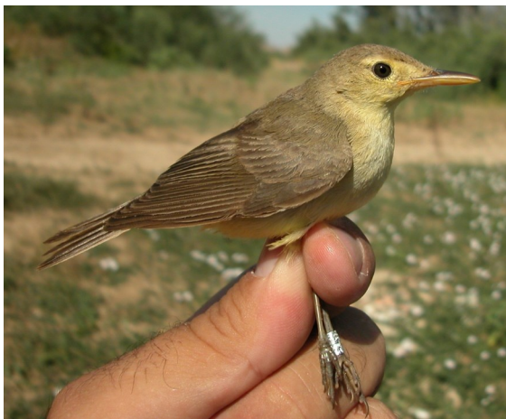
Zarcero políglota. Otoño. Adulto (20-VII).