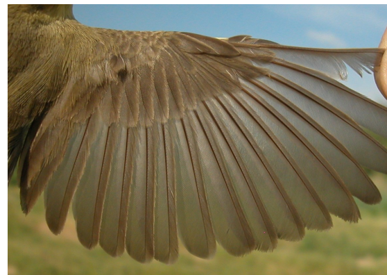
Zarcero polígnota. Primavera: diseño del ala (06-VI).