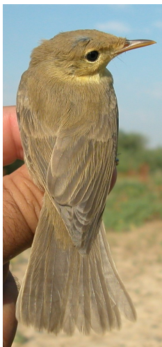
Zarcero polígnota. Desgaste del plumaje: arriba izquierda en primavera (05-VI); arriba derecha adulto en otoño (20-VII); izquierda juvenil (20-VII).