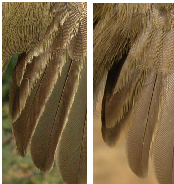
Zarcero políglota. Otoño. Determinación de la edad. Desgaste de terciarias: izquierda adulto; derecha juvenil.

En primavera , después de las mudas postnupcial/postjuvenil no es posible datar la edad utilizando el diseño del plumaje. Algunos autores indican que algunos ejemplares de 2º año muestran a veces restos de puntos negros en la lengua.