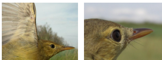
Zarcero políglota. Diseño axilares y cerdas de la comisura de la boca..

12-13 cm. Dorso verde oliva; partes inferiores amarillentas; ceja amarilla poco marcada; pico y patas pardas; axilares amarillentas; con cerdas en la comisura de la boca.