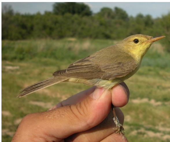
Zarcero políglota. Primavera (06-VI).