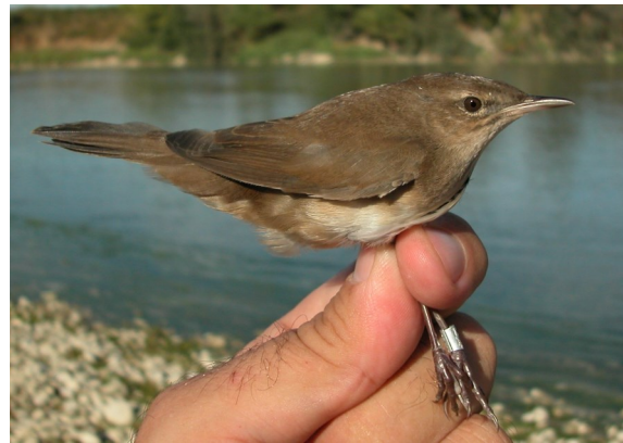
Buscarla unicolor. Otoño. Adulto con muda completa (05-IX).