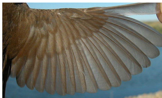
Buscarla unicolor. Otoño. 1º año no mudado: diseño del ala (06-IX).