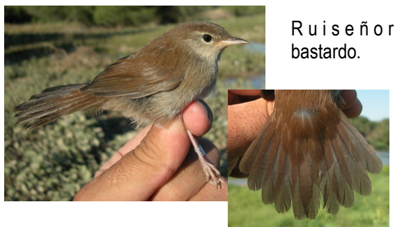
R u i s e ñ o r b a s t a r d o .

Parecida al carricero común , que tiene cerdas en la comisura de la boca y cola con plumas de similar longitud; el ruiseñor bastardo tiene 10 plumas en la cola.