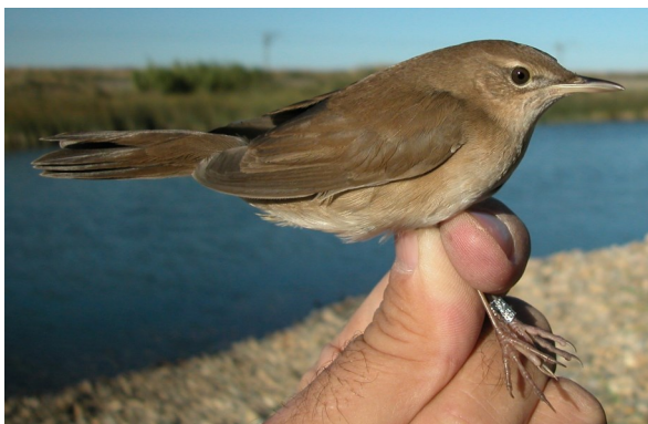
Buscarla unicolor. Otoño. Adulto con muda suspendida (18-IX).