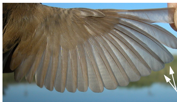
Buscarla unicolor. Otoño. 1º año con muda suspendida: diseño del ala (24-VIII).