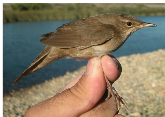
Buscarla unicolor. Otoño. 1º año con muda suspendida (24-VIII).