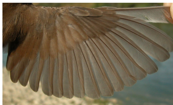
Buscarla unicolor. Otoño. Adulto con muda completa: diseño del ala (05-IX).