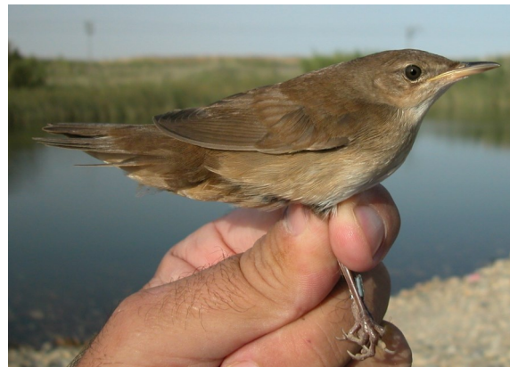
Buscarla unicolor. Otoño. 1º año no mudado (06-IX).

Muda postnupcial completa, que puede ser terminada en las zonas de cría, suspenderla antes de la migración y acabarla en las áreas de invernada o comenzarla después de la migración. La muda postjuvenil puede o no existir o tener una extensión variable cambiando algunas primarias externas, terciarias y grandes coberteras. Ambos tipos de edad tienen en invierno una muda prenupcial muy variable que puede ser parcial, dejando algunas primarias o coberteras primarias sin cambiar, completa o suspendida, para ser terminada durante la migración de primavera.