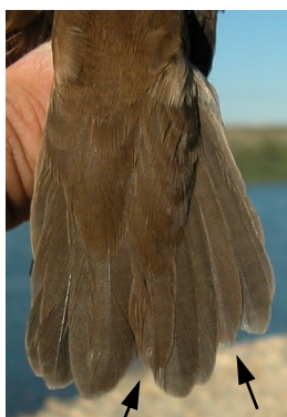
Buscarla unicolor. Otoño. 1º año. Diseño de la cola: izquierda no mudado (06-IX); derecha con muda suspendida (24-VIII).