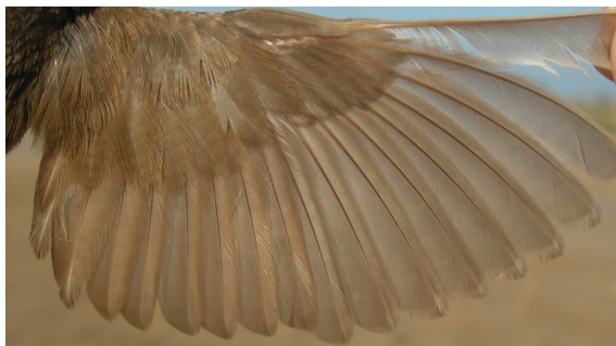
Buscarla unicolor. Otoño. Adulto con muda no comenzada: diseño del ala (07-VII).