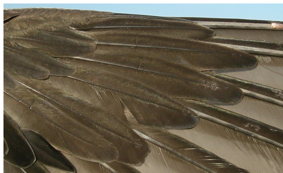
Vencejo real. Adulto: diseño de coberteras primarias (10-VII).