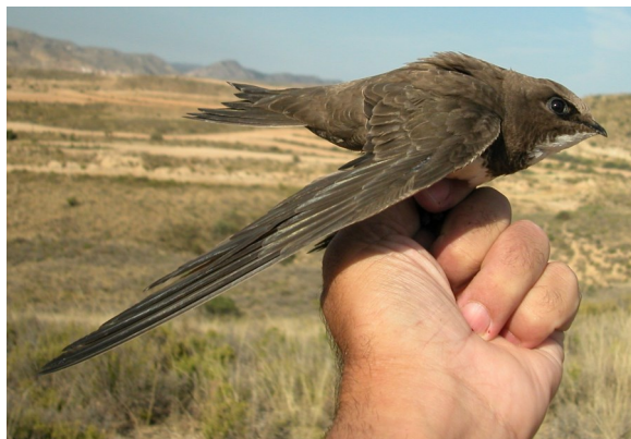
Vencejo real. Adulto (10-VII).