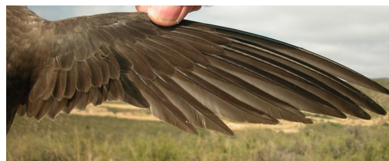
Vencejo real. Adulto: diseño del ala (10-VII).