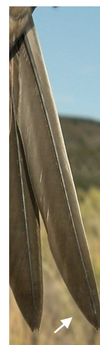
Vencejo real. Determinación de la edad. Diseño de la pluma más externa de la cola: izquierda adulto; derecha juvenil.