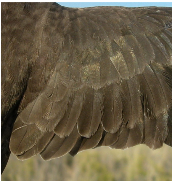
Vencejo real. Adulto: diseño de coberteras y secundarias (10-VII).