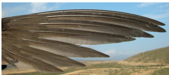
Vencejo real. Adulto: diseño de primarias (10-VII).