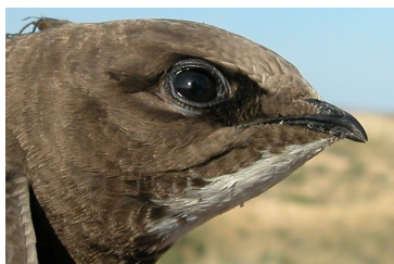
Vencejo real. Diseño de la cabeza: arriba adulto (10-VII); centro 2º año (10-VII); abajo juvenil (21-VIII).