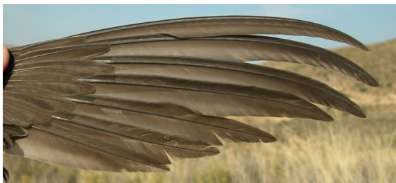
Vencejo real. 2º año: diseño de primarias (10-VII).