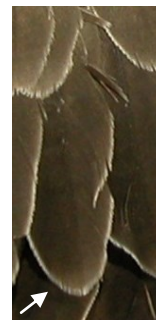
Vencejo real. Determinación de la edad. Diseño de coberteras del ala: izquierda adulto; derecha juvenil.