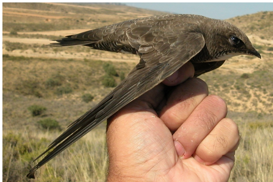
Vencejo real. 2º año (10-VII).