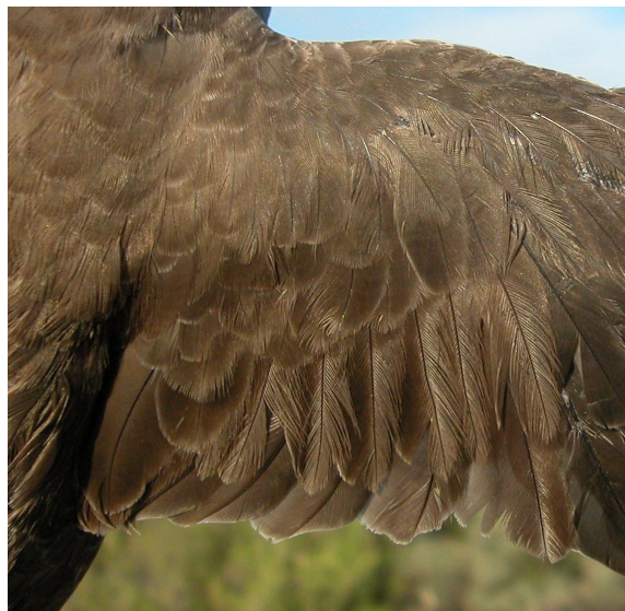
Vencejo real. 2º año: diseño de coberteras y secundarias (10-VII).