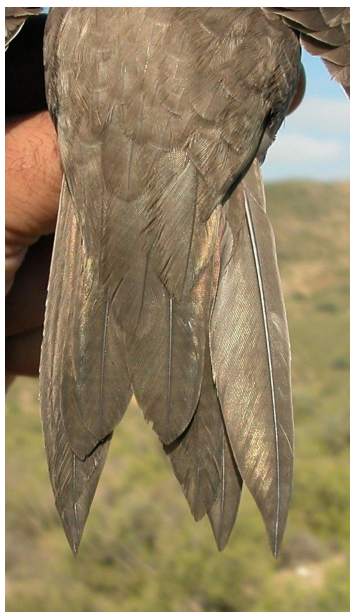
Vencejo real. Adulto: diseño de la pluma externa de la cola (10-VII).