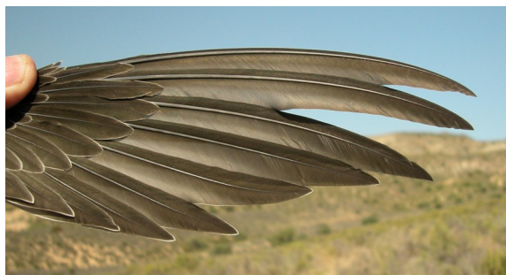
Vencejo real. Juvenil: diseño de primarias (21-VIII).