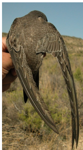
Vencejo real. Diseño del dorso: arriba izquierda adulto (10-VII); arriba derecha 2º año (10-VII); izquierda juvenil (21-VIII).