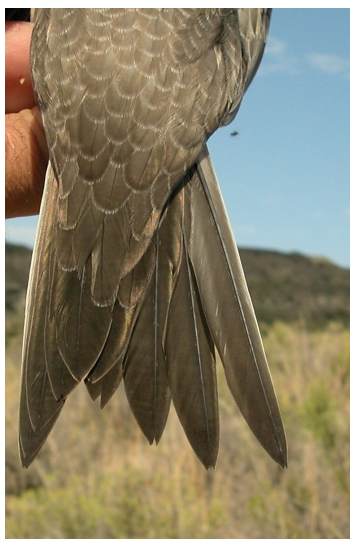
Vencejo real. Juvenil: diseño de la pluma externa de la cola (21-VIII).