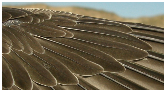
Vencejo real. Juvenil: diseño de coberteras primarias (21-VIII).