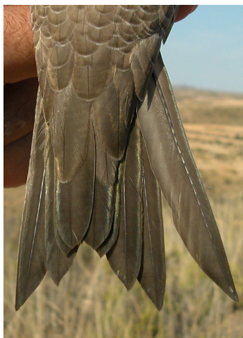
Vencejo real. 2º año: diseño de la pluma externa de la cola (10-VII).