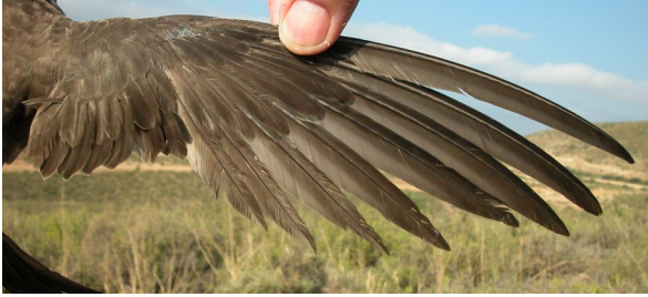
Vencejo real. 2º año: diseño del ala (10-VII).