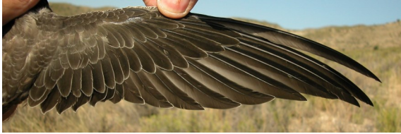
Vencejo real. Juvenil: diseño del ala (21-VIII).