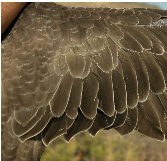
Vencejo real. Juvenil: diseño de coberteras y secundarias (21-VIII).