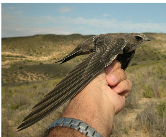
Vencejo real. Juvenil (21-VIII).