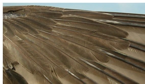
Vencejo real. 2º año: diseño de coberteras primarias (10-VII).