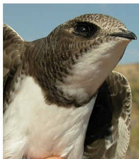
Vencejo real. Diseño del pecho: arriba izquierda adulto (10-VII); arriba derecha 2º año (10-VII); izquierda juvenil (21-VIII).