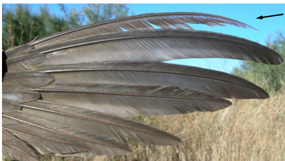
Vencejo común. 3º año: diseño de primarias (01-VII).