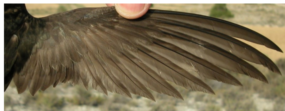
Vencejo común. 2º año: diseño del ala (13-VII).