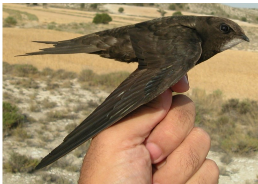
Vencejo común. Adulto (13-VII).