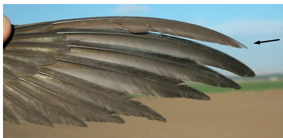
Vencejo común. Adulto con 10ª primaria retenida: diseño de primarias (02-V).