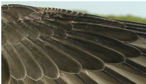
Vencejo común. Juvenil: diseño de coberteras primarias (10-VII).