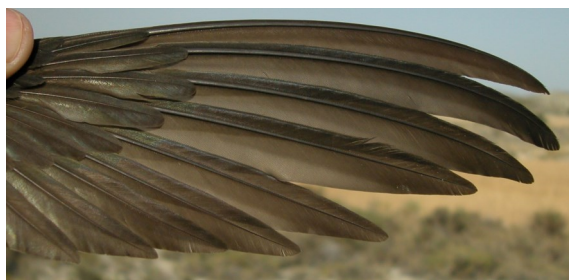
Vencejo común. Adulto: diseño de primarias (13-VII).