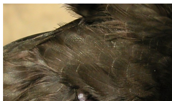
Vencejo común. Detalle de garganta, cola y flanco.