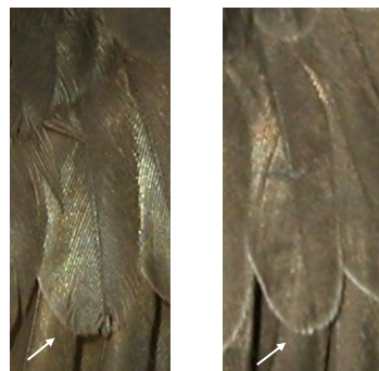
Vencejo común. Determinación de la edad. Diseño de coberteras del ala: izquierda adulto; derecha juvenil.

Adulto con el plumaje sin ribetes blancos; plumas de vuelo y coberteras del ala menos desgastadas que en 2º año ; si las primarias externas han sido retenidas, estarán marrones y desgastadas contrastando con las plumas vecinas cambiadas; pluma más externa de la cola con ambas barbas rectas.