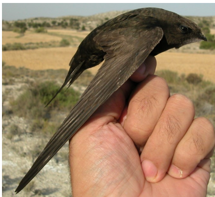
Vencejo común. 2º año (13-VII).