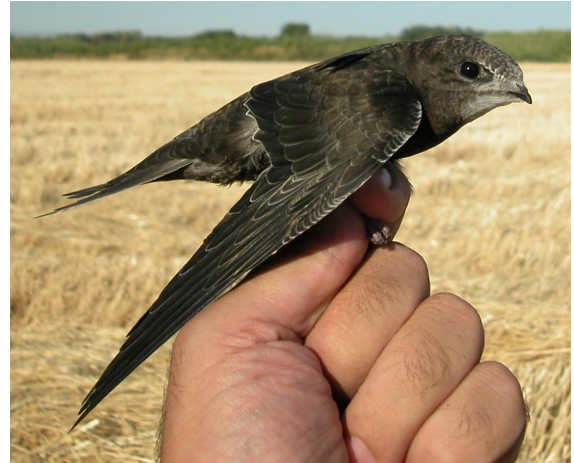
Vencejo común. Juvenil (10-VII).