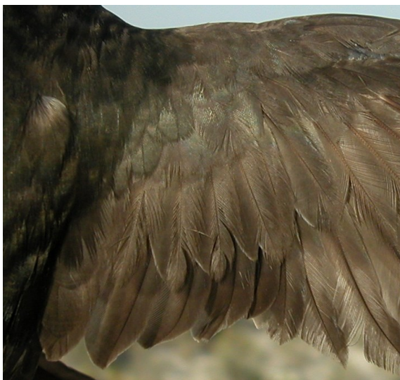
Vencejo común. 2º año: diseño de secundarias y coberteras del ala (13-VII).