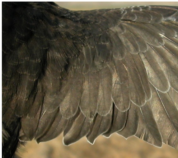
Vencejo común. Juvenil: diseño de secundarias y coberteras del ala (10-VII).