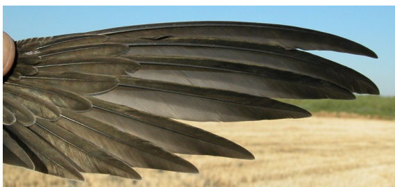
Vencejo común. Juvenil: diseño de primarias (10-VII).