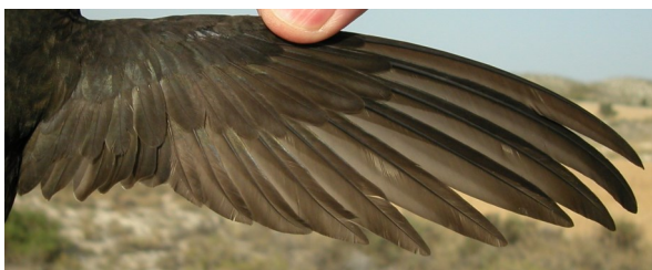
Vencejo común. Adulto: diseño del ala (13-VII).