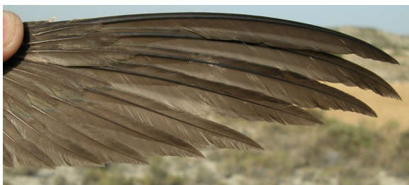
Vencejo común. 2º año: diseño de primarias (13-VII).