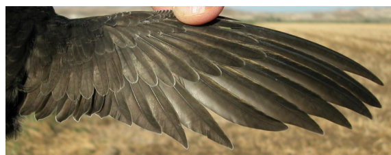
Vencejo común. Juvenil: diseño del ala (10-VII).