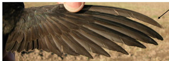
Vencejo común. Adulto con 10ª primaria retenida: diseño del ala (02-V).