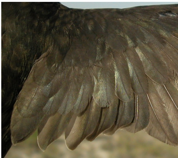
Vencejo común. Adulto: diseño de secundarias y coberteras del ala (13-VII).