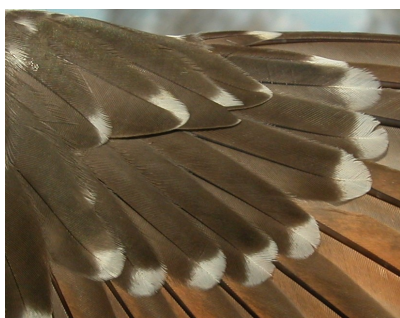
Críalo. 2º año: diseño de coberteras primarias (08-IV)