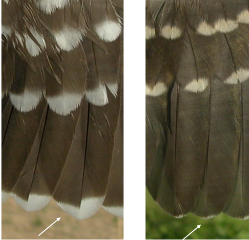
Críalo. Determinación de la edad. Diseño de secundarias: izquierda adulto; derecha juvenil.