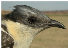
Críalo. Determinación de la edad. Diseño de la cabeza: arriba adulto; abajo juvenil.

Adulto con píleo gris; dorso gris moteado de blanco; garganta y pecho amarillo claro; primarias de color gris; secundarias con mancha blanca grande en la punta. CAIDADO : si ha dejado sin mudar alguna secundaria, entonces hay dos generaciones de plumas, aunque todas tienen las puntas con igual mancha blanca grande.