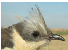
Críalo. Adulto. Diseño de la cabeza.

39-45 cm. Adulto con dorso pardo ampliamente moteado de blanco; partes inferiores amarillo crema; cola larga; penacho conspicuo en la cabeza; alas pardas. Juveniles con primarias de color castaño; sin penacho; partes inferiores muy amarillas.