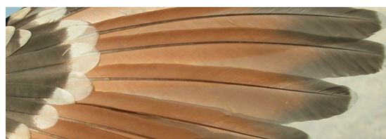
Críalo. Determinación de la edad. Diseño de primarias: arriba adulto; abajo juvenil.