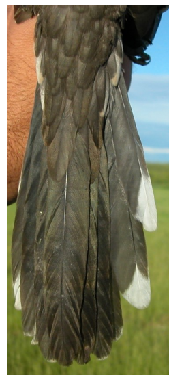
Críalo. Diseño de la cola: arriba izquierda adulto (28-II); arriba derecha 2º año (08-IV); izquierda juvenil (02-VI).