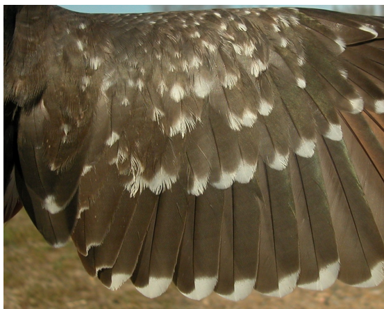
Críalo. 2º año con muda completa: diseño de secundarias y coberteras del ala (08-IV)