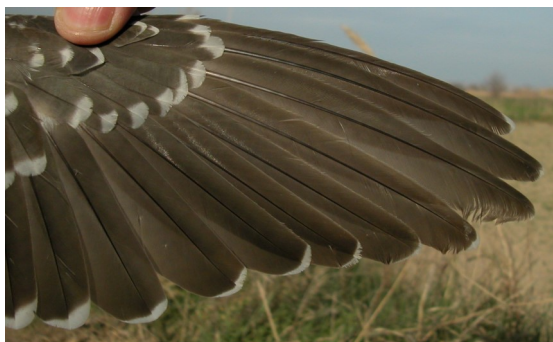
Críalo. Adulto: diseño de primarias (28-II)