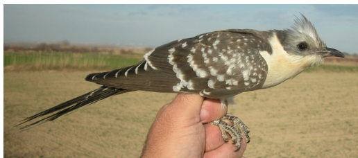
Críalo. Adulto (28-II)