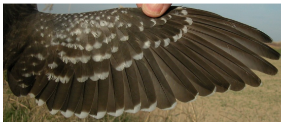
Críalo. Adulto con muda completa: diseño del ala (28-II)