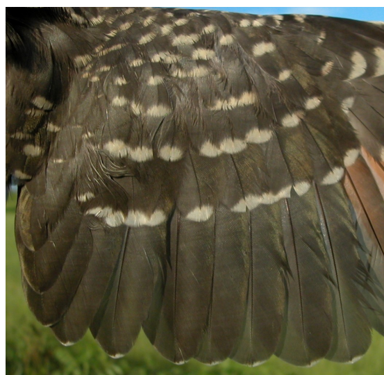
Críalo. Juvenil. Diseño de secundarias y coberteras del ala (02-VI)