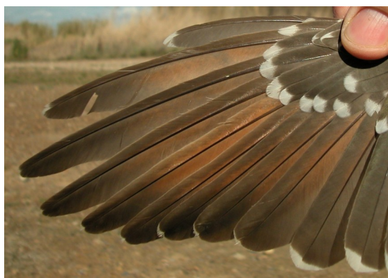
Críalo. 2º año: diseño de primarias con tinte rojizo (08-IV)