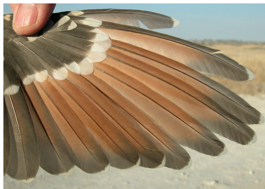
Críalo. Juvenil: diseño de primarias (02-VI)