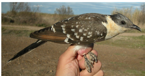
Críalo. 2º año con primarias rojizas (08-IV)