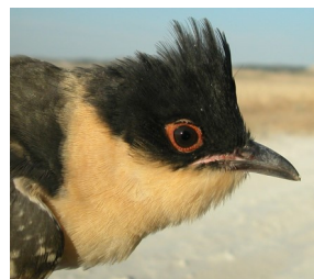
Críalo. Determinación de la edad. Diseño de la garganta y pecho: arriba adulto; abajo juvenil.