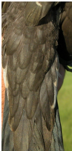
Críalo. Diseño del obispillo: arriba izquierda adulto (28-II); arriba derecha 2º año (08-IV); izquierda juvenil (02-VI).