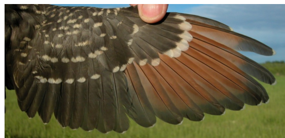
Críalo. Juvenil: diseño del ala (02-VI)