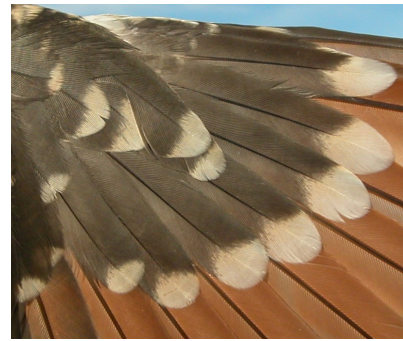
Críalo. Juvenil: diseño de coberteras primarias (02-VI)