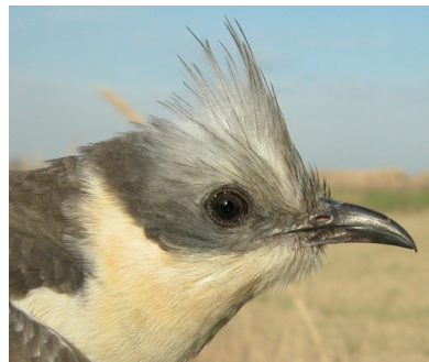
Críalo. Adulto. Diseño de la cabeza: arriba adulto (28-II); centro 2º año (08-IV); abajo juvenil (02-VI).