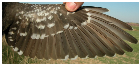
Críalo. 2º año con primarias poco rojizas y muda parcial: diseño del ala (22-III)