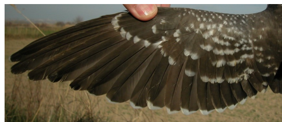
Críalo. Adulto con plumas retenidas: diseño del ala (28-II)