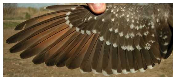
Críalo. 2º año con primarias rojizas y muda completa: diseño del ala (08-IV)