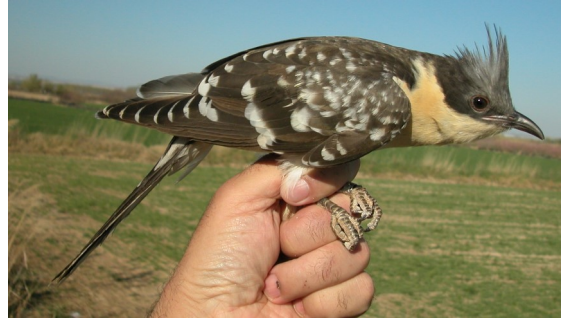
Críalo. 2º año con primarias poco rojizas (22-III)