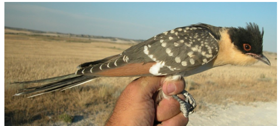
Críalo. Juvenil (02-VI)