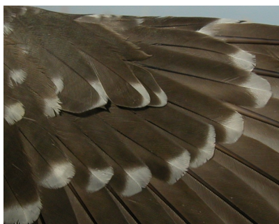
Críalo. Adulto: diseño de coberteras primarias (28-II)