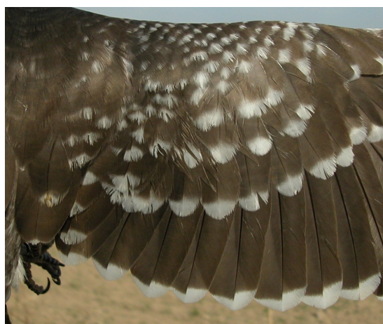
Críalo. Adulto con muda completa: diseño de secundarias y coberteras del ala (28-II)