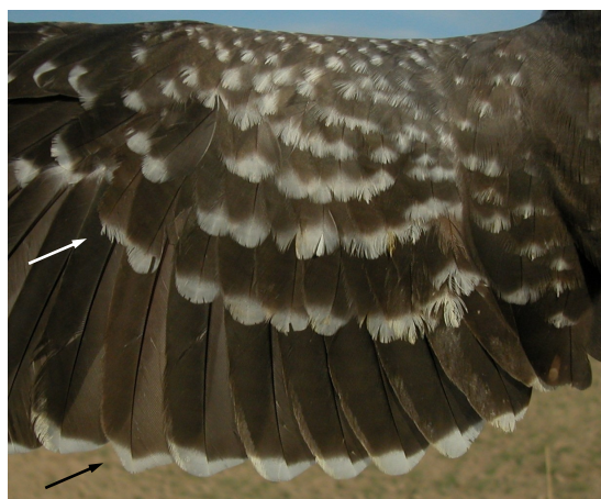
Críalo. Adulto con plumas retenidas: diseño de secundarias y coberteras del ala (28-II)