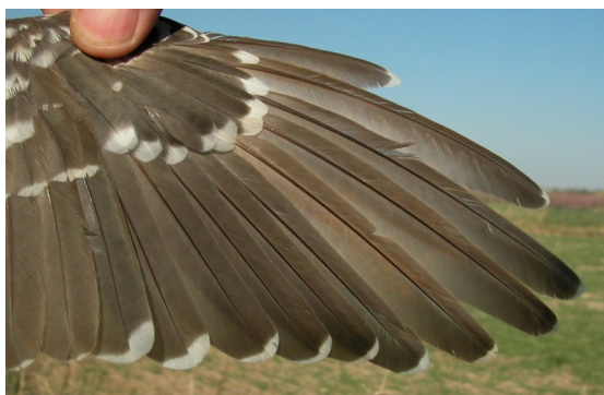
Críalo. 2º año: diseño de primarias con poco tinte rojizo (22-III).