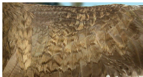
Andarríos chico. Verano. Adulto: diseño de las coberteras del ala con plumaje poco desgastado (27-VII).