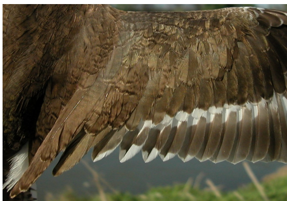
Andarríos chico. Primavera. 2º año: diseño de secundarias (02-V).