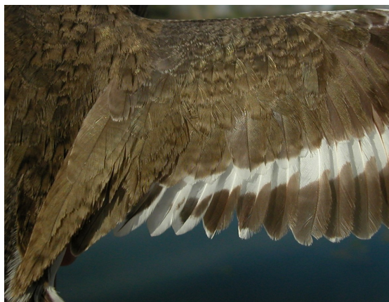
Andarríos chico. Verano. 2º año: diseño de secundarias (12-VIII).