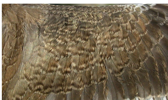
Andarríos chico. Verano. Juvenil: diseño de las coberteras del ala (05-VIII).