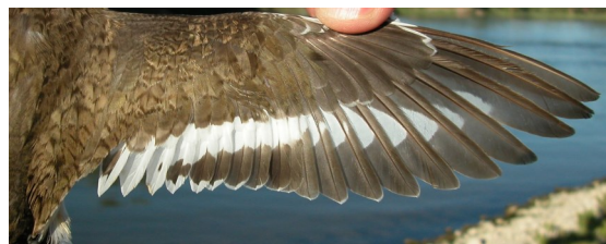
Andarríos chico. Verano. Adulto: diseño del ala con plumaje poco desgastado (27-VII).