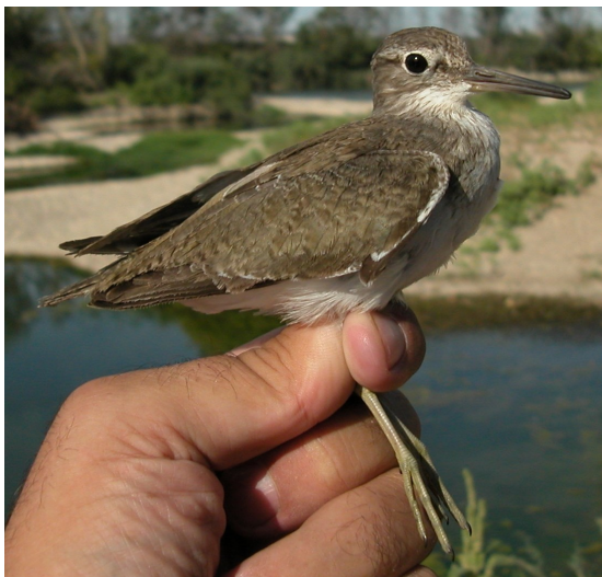
Andarríos chico. Verano. 2º año (12-VIII).

Andarríos chico. Verano. Diseño de la cabeza: arriba adulto (27-VII); centro 2º año (12-VIII); abajo juvenil (05-VIII).