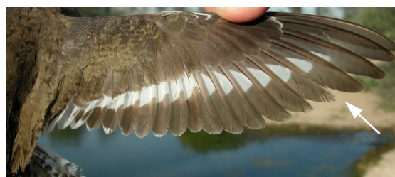
Andarríos chico. Verano. 2º año: diseño del ala (12-VIII).