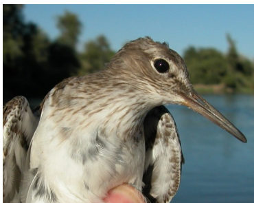
Andarríos chico. Verano. Diseño del pecho: arriba adulto (27-VII); centro 2º año (12-VIII); abajo juvenil (05-VIII).