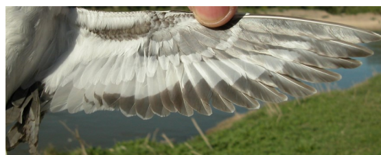
Andarríos chico. Primavera. 2º año: diseño del ala (02-V).