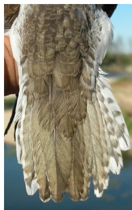
Andarríos chico. Verano. Diseño de la cola: arriba izquierda adulto (27-VII); arriba derecha 2º año (12-VIII); izquierda juvenil (05-VIII).