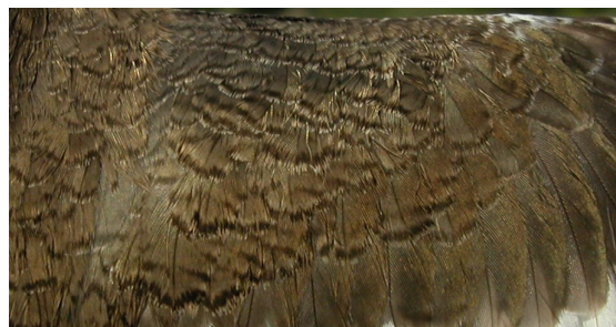
Andarríos chico. Primavera. Adulto: diseño de coberteras del ala (01-V).