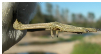
Andarríos chico. Verano. Juvenil. Color de las patas: arriba con patas verdes (05-VIII); abajo con patas rosadas (01-VIII).