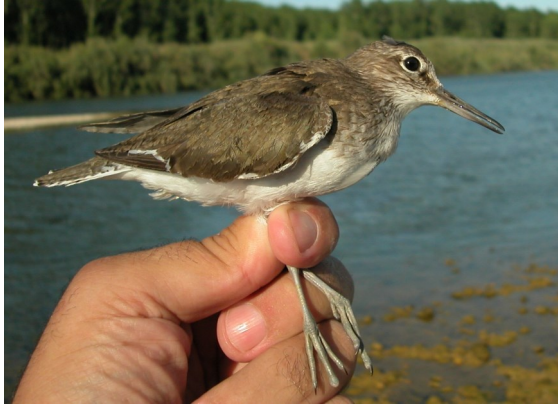
Andarríos chico. Verano. Adulto con plumaje desgastado (31-VII).