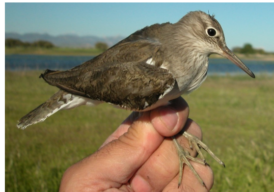
Andarríos chico. Primavera. 2º año (02-V).