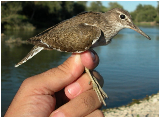
Andarríos chico. Verano. Adulto con plumaje poco desgastado (27-VII).