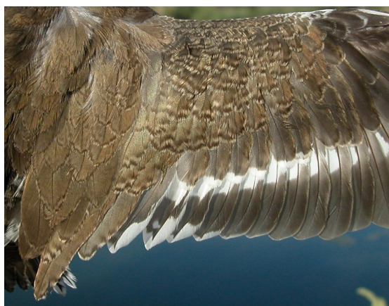
Andarríos chico. Verano. Juvenil: diseño de secundarias (05-VIII).