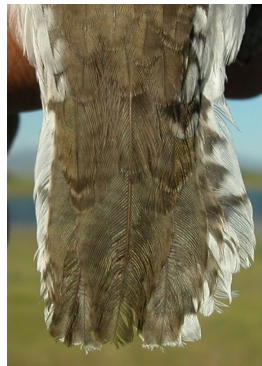
Andarríos chico. Primavera. Diseño de la cola: izquierda adulto (01-V); derecha 2º año (02-V).