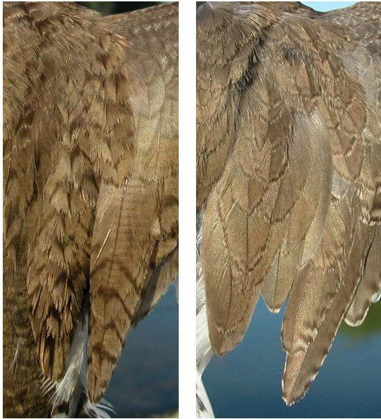
Andarríos chico. Verano. Determinación de la edad. Diseño de escapulares y terciarias: izquierda adulto; derecha juvenil.