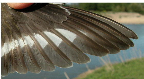
Andarríos chico. Primavera. Adulto: diseño de primarias (01-V).