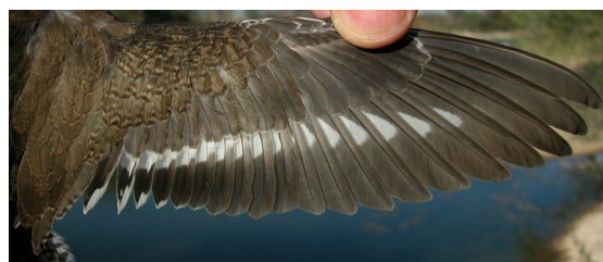
Andarríos chico. Verano. Juvenil: diseño del ala (05-VIII).