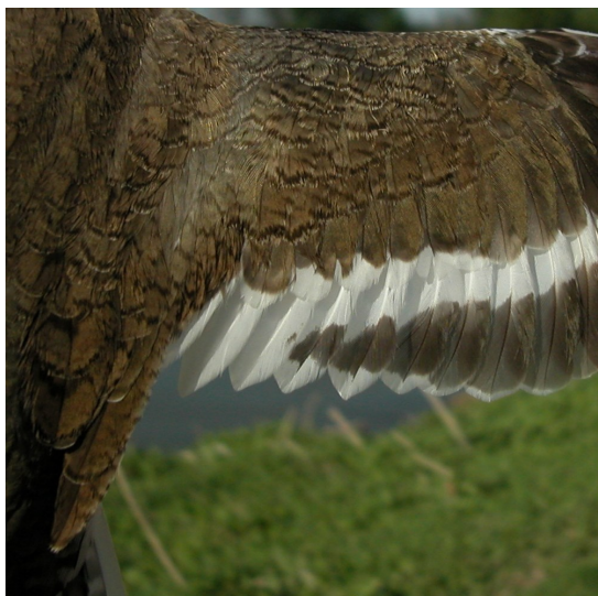
Andarríos chico. Primavera. Adulto: diseño de secundarias (01-V).