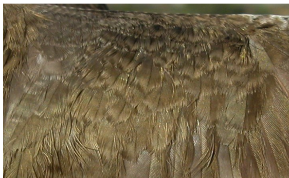
Andarríos chico. Verano. 2º año: diseño de las coberteras del ala (12-VIII).