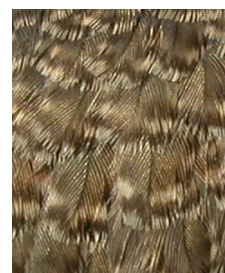
Andarríos chico. Verano. Determinación de la edad. Diseño de las coberteras del ala: izquierda adulto; derecha juvenil.