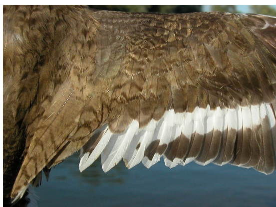
Andarríos chico. Verano. Adulto: diseño de secundarias con plumaje poco desgastado (27-VII).