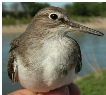
Andarríos chico. Primavera. Diseño del pecho: arriba adulto (01-V); abajo 2º año (02-V).