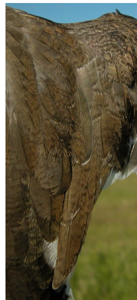
Andarríos chico. Primavera. Diseño de terciarias: izquierda adulto (01-V); derecha 2º año (02-V).