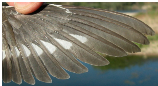
Andarríos chico. Verano. Juvenil: diseño de primarias (05-VIII).