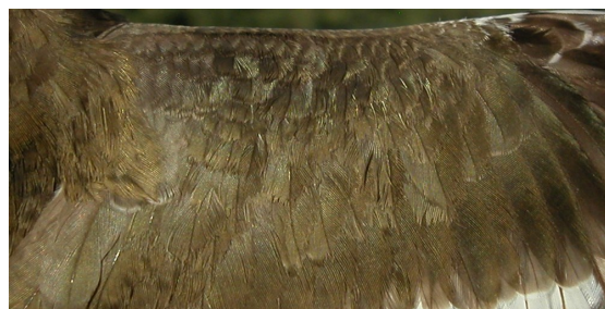
Andarríos chico. Verano. Adulto: diseño de las coberteras del ala con plumaje desgastado (31-VII).