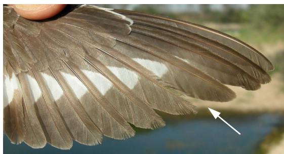
Andarríos chico. Verano. 2º año: diseño de primarias (12-VIII).