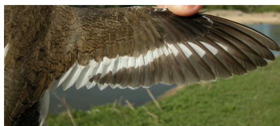
Andarríos chico. Primavera. Adulto: diseño del ala (01-V).