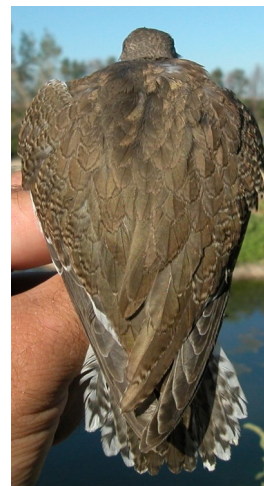
Andarríos chico. Verano. Diseño del dorso: izquierda 2º año (12-VIII); derecha juvenil (05-VIII).