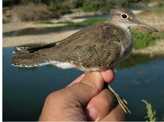
Andarríos chico. Verano. Juvenil (05-VIII).