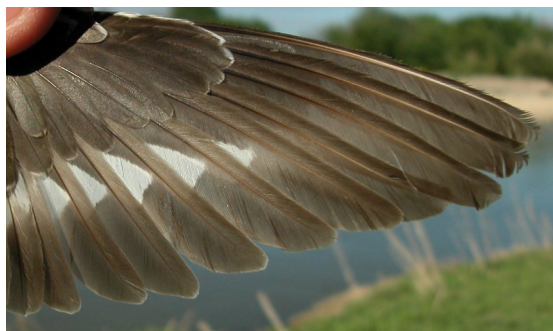
Andarríos chico. Primavera. 2º año: diseño de primarias (02-V).