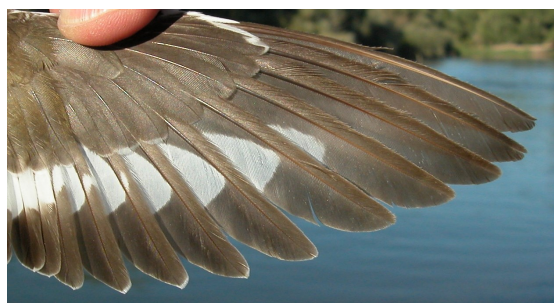
Andarríos chico. Verano. Adulto: diseño de primarias (27-VII).