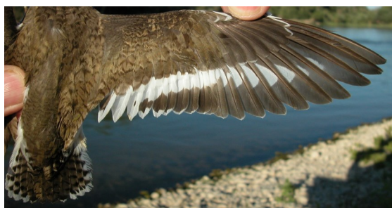
Andarríos chico. Diseño del obispillo, cola y ala.

19-22 cm. Partes superiores pardo oliva, incluido el obispillo y cola; partes inferiores blancas, con pecho ligeramente rayado de oscuro; alas con banda blanca; pico oscuro y patas verdosas.