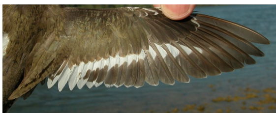
Andarríos chico. Verano. Adulto: diseño del ala con plumaje desgastado (31-VII).