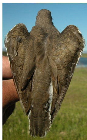
Andarríos chico. Primavera. Diseño del dorso: izquierda adulto (01-V); derecha 2º año (02-V).