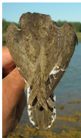
Andarríos chico. Verano. Adulto. Diseño del dorso: izquierda con plumaje poco desgastado (27-VII); derecha con plumaje desgastado (31-VII).