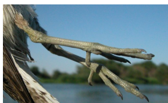
Andarríos chico. Verano. Color de las patas: arriba adulto (27-VII); abajo 2º año (12-VIII).