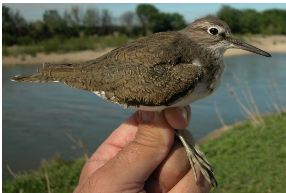
Andarríos chico. Primavera. Adulto (01-V).