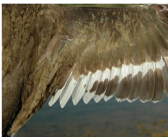
Andarríos chico. Verano. Adulto: diseño de secundarias con plumaje desgastado (31-VII).