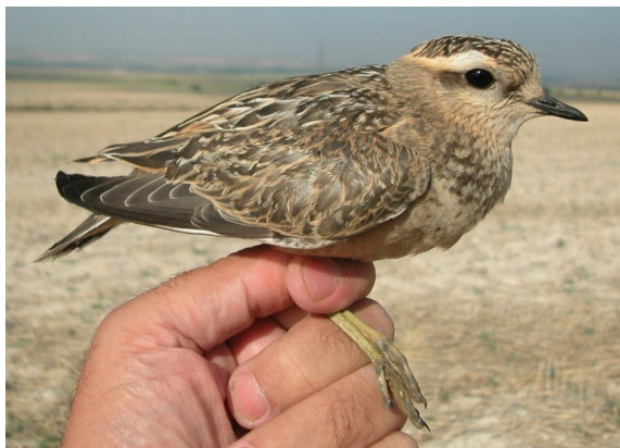
Chorlito carambolo. Otoño. 1º año (28-VIII).