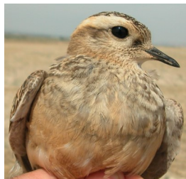
Chorlito carambolo. Otoño. Diseño del pecho: arriba izquierda adulto poco mudado (01-IX); arriba derecha adulto en eclipse (07-X); izquierda 1º año (28-VIII).