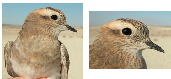
Chorlito carambolo. Adulto. Plumaje en eclipse. Diseño de la línea del pecho y ceja.