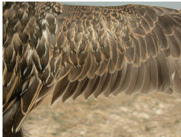
Chorlito carambolo. Otoño. 1º año: diseño de secundarias (28-VIII).