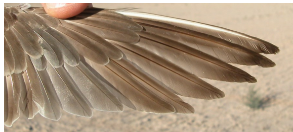
Chorlito carambolo. Otoño. Adulto poco mudado: diseño de primarias (01-IX).