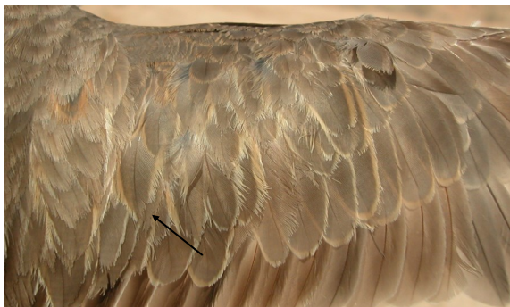
Chorlito carambolo. Otoño. Adulto poco mudado: diseño de coberteras del ala (01-IX).