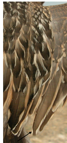
Chorlito carambolo. Otoño. Diseño de terciarias: arriba izquierda adulto poco mudado (01-IX); arriba derecha adulto en eclipse (07-X); izquierda 1º año (28-VIII).