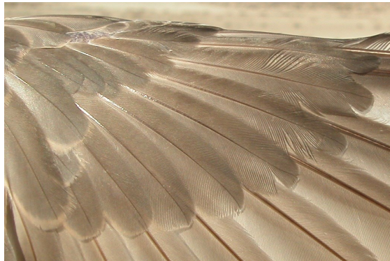
Chorlito carambolo. Otoño. Adlto en eclipse: diseño de coberteras primarias (07-X).