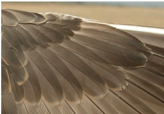
Chorlito carambolo. Otoño. 1º año: diseño de coberteras primarias (28-VIII).