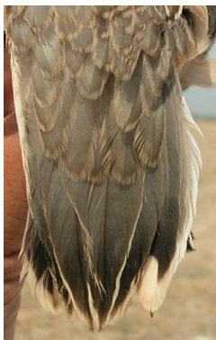
Chorlito carambolo. Otoño. Diseño de la cola: arriba izquierda adulto poco mudado (01-IX); arriba derecha adulto en eclipse (07-X); izquierda