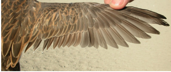
Chorlito carambolo. Otoño. Adulto en eclipse: diseño del ala (07-X).