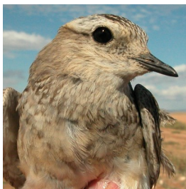
Chorlito carambolo. Otoño. Determinación de la edad. Diseño del pecho: arriba izquierda adulto poco mudado; arriba derecha adulto en eclipse; izquierda 1º año.