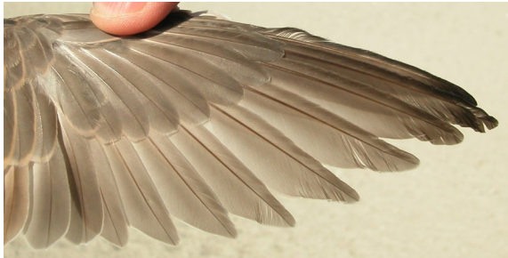
Chorlito carambolo. Otoño. Adulto en eclipse: diseño de primarias (07-X).