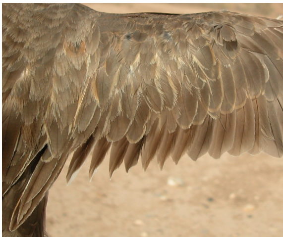
Chorlito carambolo. Otoño. Adulto poco mudado: diseño de secundarias (01-IX).