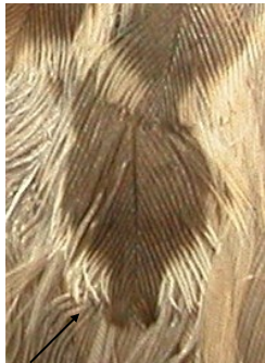
Chorlito carambolo. Otoño. Determinación de la edad. Diseño de medianas coberteras: izquierda adulto; derecha 1º año.