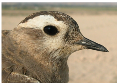
Chorlito carambolo. Otoño. Diseño de la cabeza: arriba adulto poco mudado (01-IX); centro adulto en eclipse (07-X); abajo 1º año (28-VIII).