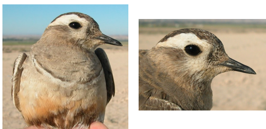
Chorlito carambolo. Adulto. Plumaje nupcial. Diseño de la línea del pecho y ceja.

21-23 cm. En plumaje nupcial , parte inferior del pecho ocre y vientre negro. En invierno , con plumaje gris. En cualquier época pecho atravesado por una línea blanca y ceja de color claro; patas amarillas. Juveniles grises como los adultos en plumaje de invierno .