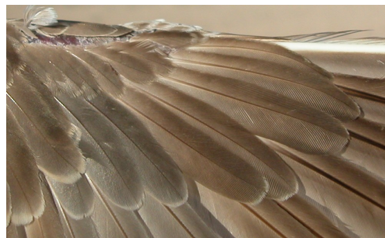
Chorlito carambolo. Otoño. Adulto poco mudado: diseño de coberteras primarias (01-IX).