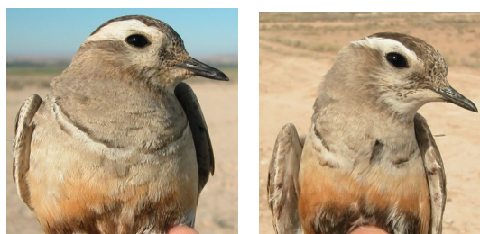
Chorlito carambolo. Determinación del sexo. Diseño del pecho: izquierda macho; derecha hembra.

En plumaje nupcial ambos sexos con un diseño muy similar, pero los machos con colores más apagados que las hembras . Los adultos en plumaje invernal y juveniles no se pueden sexar.