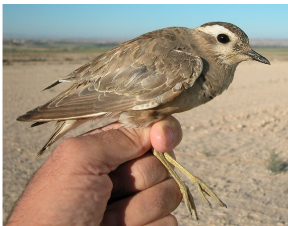
Chorlito carambolo. Otoño. Adulto poco mudado (01-IX).