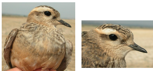
Chorlito carambolo. 1º año. Diseño de pecho y ceja.