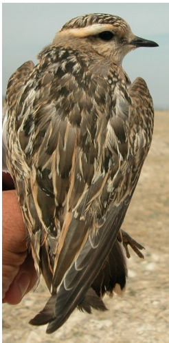
Chorlito carambolo. Otoño. Diseño del dorso: arriba izquierda adulto poco mudado (01-IX); arriba derecha adulto en eclipse (07-X); izquierda 1º año (28-VIII).