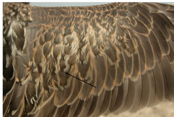
Chorlito carambolo. Otoño. 1º año: diseño de coberteras del ala (28-VIII).