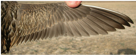
Chorlito carambolo. Otoño. 1º año: diseño del ala (28-VIII).