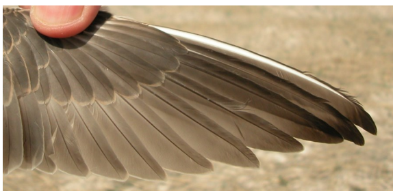
Chorlito carambolo. Otoño. 1º año: diseño de primarias (28-VIII).