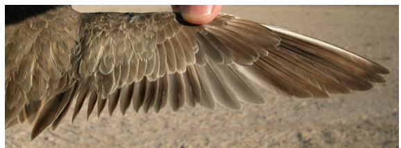
Chorlito carambolo. Otoño. Adulto poco mudado: diseño del ala (01-IX).