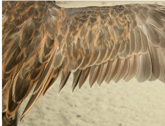
Chorlito carambolo. Otoño. Adulto en eclipse: diseño de secundarias (07-X).