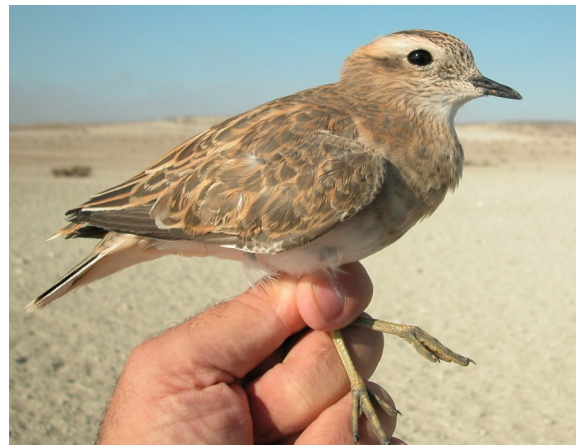
Chorlito carambolo. Otoño. Adulto en eclipse (07-X).