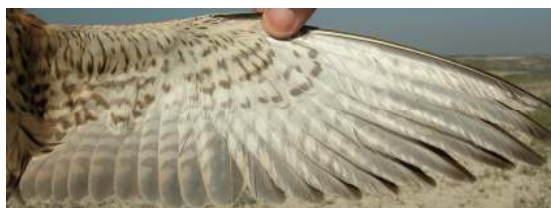
Cernícalo primilla. 2º año. Hembra: diseño del ala (12-VI).