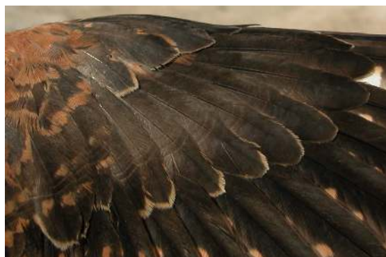
Cernícalo primilla. 2º año. Macho: diseño de coberteras primarias (12-V).