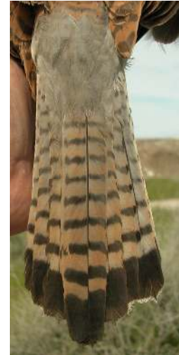
Cernícalo primilla. Adulto. Diseño de la cola: izquierda macho (16-VI); derecha hembra (07-VI).