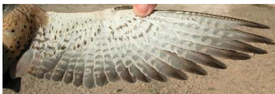
Cernícalo primilla. 2º año. Macho: diseño del ala (12-V).