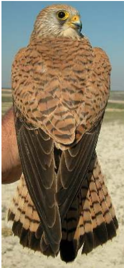
Cernícalo primilla. 2º año. Diseño del dorso: arriba izquierda macho (12-V); arriba derecha macho con aspecto de hembra (11-VII); izquierda hembra (10-V).