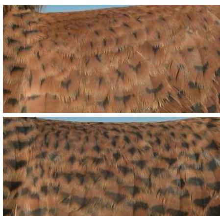
Cernícalo primilla. Determinación del sexo. Juvenil. Diseño de pequeñas coberteras: arriba macho; abajo hembra.