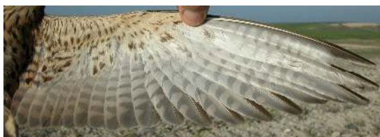
Cernícalo primilla. Adulto. Hembra: diseño del ala (07-VI).