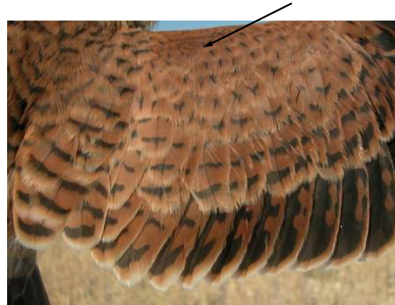
Cernícalo primilla. Juvenil. Macho: diseño de secundarias (26-VI).