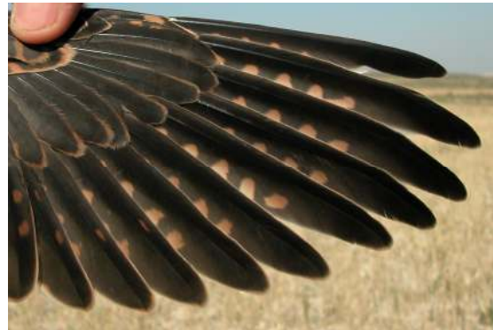
Cernícalo primilla. Juvenil. Hembra: diseño de primarias (26-VI).