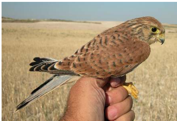
Cernícalo primilla. Juvenil. Macho (26-VI).