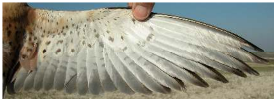
Cernícalo primilla. Adulto. Macho: diseño del ala (10-V).