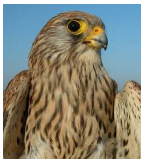
Cernícalo primilla. Adulto. Diseño del pecho: izquierda macho (16-VI); derecha hembra (07-VI).