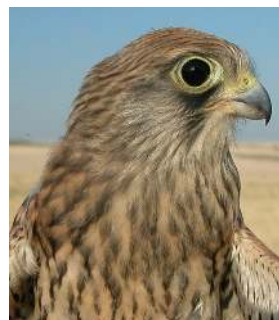
Cernícalo primilla. Juvenil. Diseño del pecho: izquierda macho (26-VI); derecha hembra (26-VI).