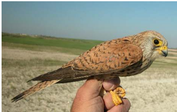
Cernícalo primilla. 2º año. Hembra (10-V).