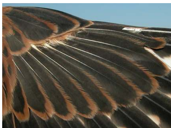
Cernícalo primilla. Juvenil. Macho: diseño de coberteras primarias (26-VI).