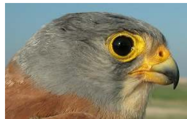
Cernícalo primilla. Determinación del sexo. Adulto. Diseño de la cabeza: arriba macho; abajo hembra.

Macho adulto con cabeza gris, sin moteado; cola, supracoberteras caudales y obispillo uniformemente grises, sin barrado; dorso ocre sin motas; alas con una franja azulada. Hembra adulta con cabeza moteada; cola barrada habitualmente con tinte grisáceo; dorso y supracoberteras alares moteados. Los juveniles se pueden sexar en casos extremos: macho con supracoberteras caudales y plumas de la cola de color gris intenso; pequeñas coberteras escasamente moteadas. Hembra con supracoberteras caudales y plumas de la cola sin tinte gris; pequeñas coberteras densamente moteadas. Después de su muda postjuvenil ambos sexos tienen las plumas corporales como los adultos .