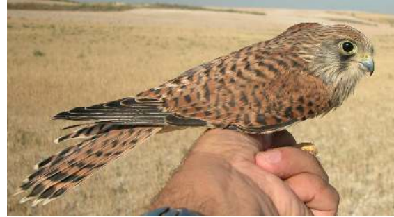
Cernícalo primilla. Juvenil. Hembra (26-VI).