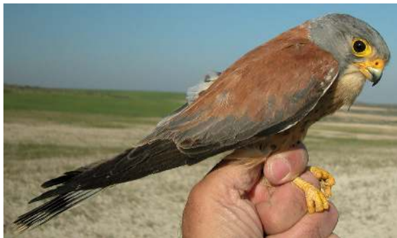
Cernícalo primilla. Adulto. Macho (10-V).