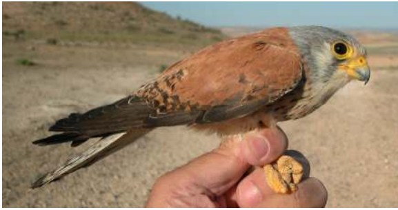
Cernícalo primilla. 2º año. Macho (12-V).