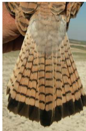
Cernícalo primilla. 2º año. Diseño de la cola: arriba izquierda macho (12-V); arriba derecha macho con aspecto de hembra (11-VII); izquierda hembra (10-V).