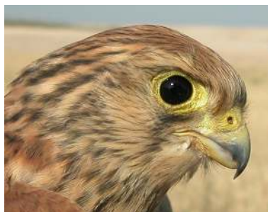
Cernícalo primilla. Juvenil. Diseño de la cabeza: arriba macho (26-VI); abajo hembra (26-VI).