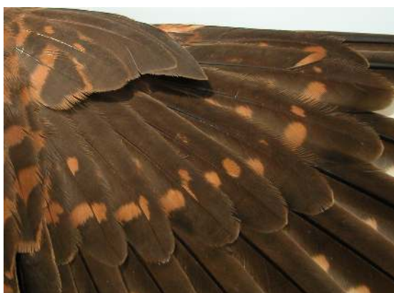
Cernícalo primilla. Adulto. Hembra: diseño de coberteras primarias (07-VI).