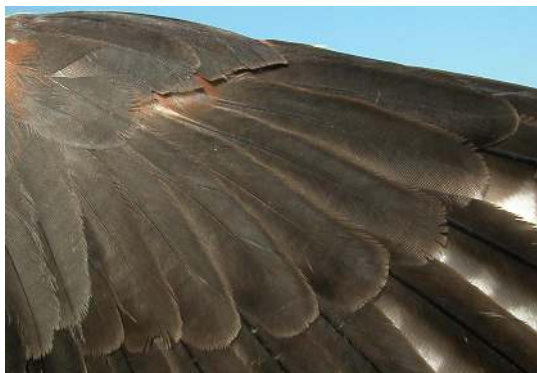
Cernícalo primilla. Adulto. Macho: diseño de coberteras primarias (16-VI).