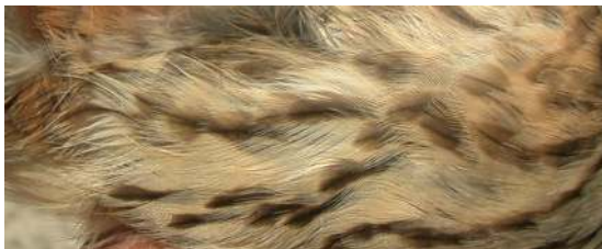
Cernícalo primilla. 2º año. Diseño del flanco: arriba macho (12-V); abajo hembra (10-V).