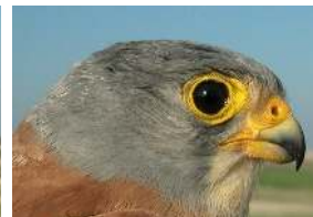
Cernícalo primilla. Macho: diseño del ala, cabeza y dorso.