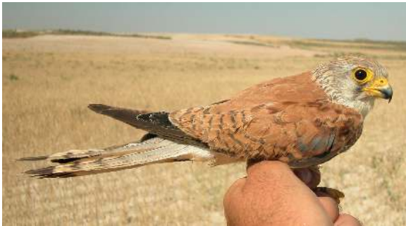
Cernícalo primilla. 2º año. Macho con aspecto de hembra (11-VII).