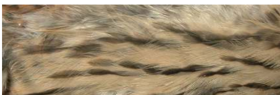
Cernícalo primilla. Juvenil. Diseño del flanco: arriba macho (26-VI); abajo hembra (26-VI).