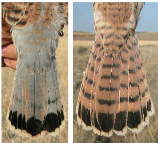
Cernícalo primilla. Juvenil. Diseño de la cola: izquierda macho (26-VI); derecha hembra (26-VI).