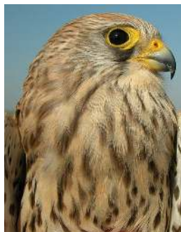
Cernícalo primilla. 2º año. Diseño del pecho: arriba izquierda macho (12-V); arriba derecha macho con aspecto de hembra (11-VII); izquierda hembra (10-V).