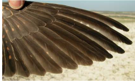
Cernícalo primilla. 2º año. Hembra: diseño de primarias (10-V).