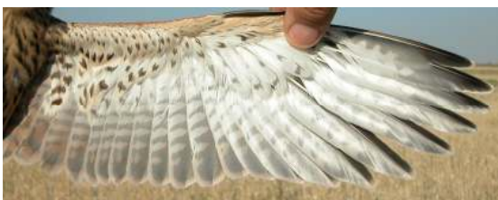
Cernícalo primilla. Juvenil. Macho: diseño del ala (26-VI).