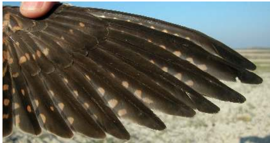
Cernícalo primilla. Adulto. Hembra: diseño de primarias (07-VI).