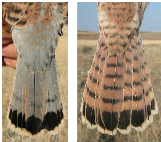
Cernícalo primilla. Determinación del sexo. Juvenil. Diseño de la cola y obispillo: izquierda macho; derecha hembra.