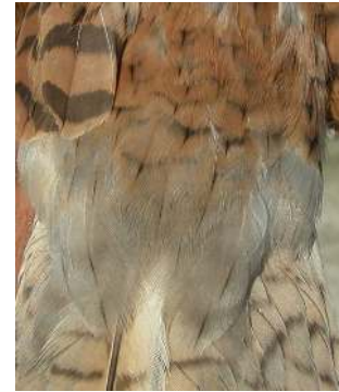
Cernícalo primilla. Adulto. Diseño del obispillo y supracoberteras de la cola: izquierda macho (16-VI); derecha hembra (07-VI).