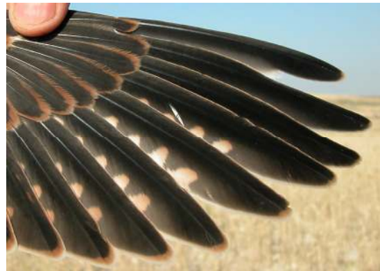
Cernícalo primilla. Juvenil. Macho: diseño de primarias (26-VI).