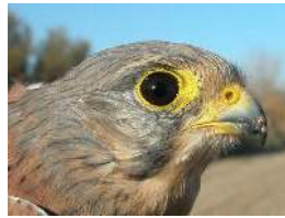
Cernícalo vulgar. Macho.