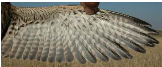
Cernícalo primilla. Juvenil. Hembra: diseño del ala (26-VI).