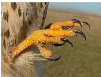
Cernícalo vulgar. Hembra: fórmula alar y color de las uñas