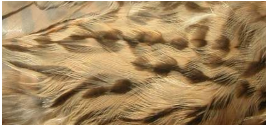
Cernícalo primilla. Adulto. Diseño del flanco: arriba macho (16-VI); abajo hembra (07-VI).