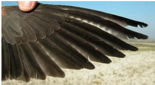
Cernícalo primilla. Adulto. Macho: diseño de primarias (16-VI).