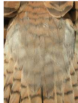
Cernícalo primilla. 2º año. Diseño del obispillo y supracoberteras de la cola: izquierda macho (12-V); derecha hembra (10-V).