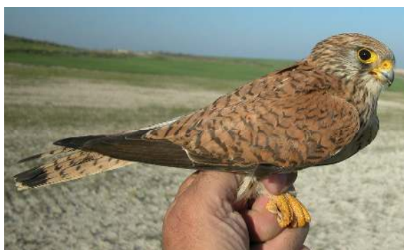
Cernícalo primilla. Adulto. Hembra (07-VI).