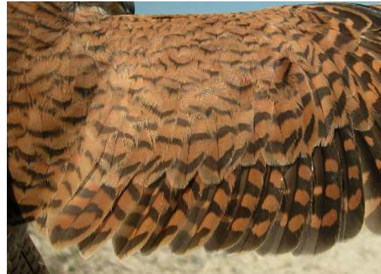
Cernícalo primilla. 2º año. Hembra: diseño de secundarias (10-V).