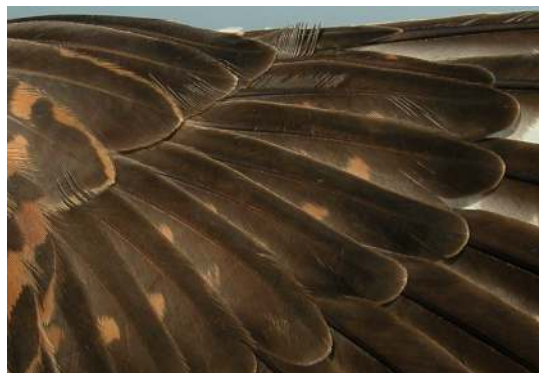
Cernícalo primilla. 2º año. Hembra: diseño de coberteras primarias (10-V).