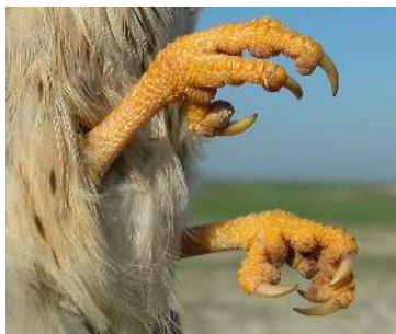
Cernícalo primilla. Hembra: fórmula alar y color de las uñas