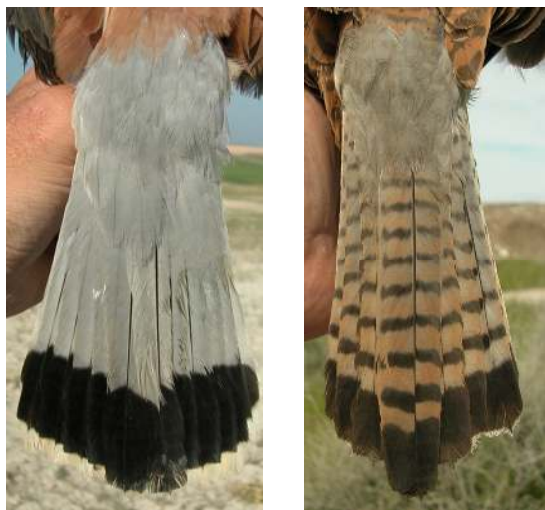
Cernícalo primilla. Determinación del sexo. Adulto. Diseño de la cola y obispillo: izquierda macho; derecha hembra.