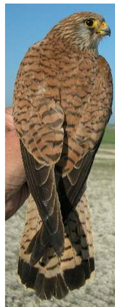
Cernícalo primilla. Adulto. Diseño del dorso: izquierda macho (16-VI); derecha hembra (07-VI).