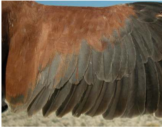
Cernícalo primilla. Adulto. Macho: diseño de secundarias (16-VI).