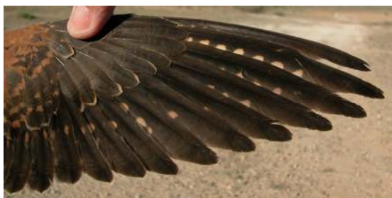
Cernícalo primilla. 2º año. Macho: diseño de primarias (12-V).