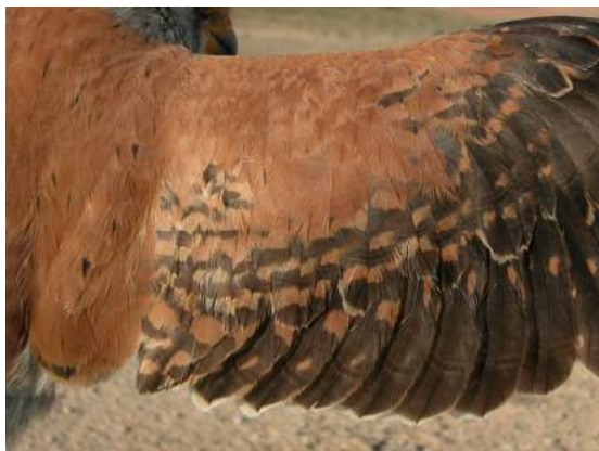
Cernícalo primilla. 2º año. Macho: diseño de secundarias (12-V).