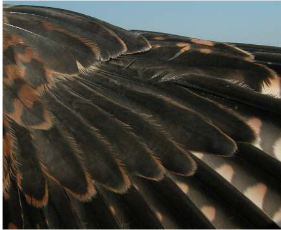
Cernícalo primilla. Juvenil. Hembra: diseño de coberteras primarias (26-VI).