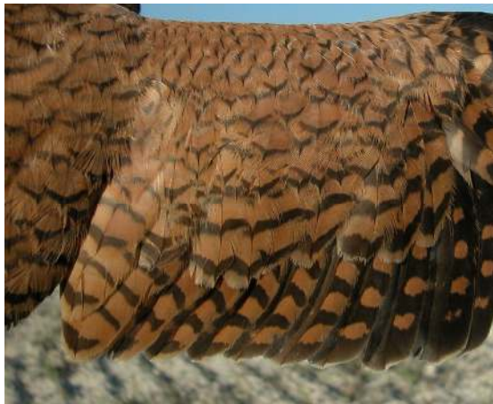
Cernícalo primilla. Adulto. Hembra: diseño de secundarias (07-VI).