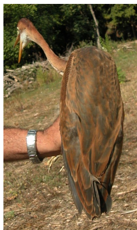
Garza imperial. Diseño del dorso: izquierda 2º año (); derecha juvenil (10-IX).