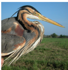
Garza imperial. Diseño del dorso y la cabeza