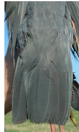
Garza imperial. Adulto. Diseño de la cola: izquierda macho (10-IX); derecha hembra (22-IV).