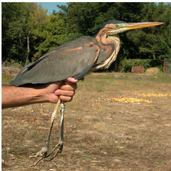
Garza imperial. Adulto. Macho (10-IX).