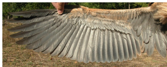
Garza imperial. Juvenil: diseño del ala (10-IX).