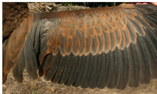
Garza imperial. 2º año: diseño de secundarias ().