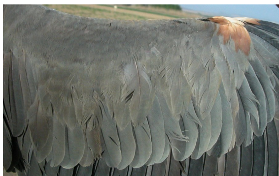
Garza imperial. Adulto. Hembra: diseño de coberteras del ala (22-IV).