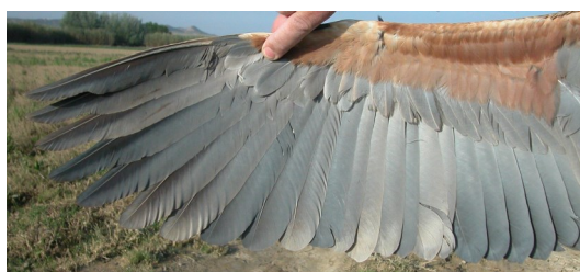
Garza imperial. Adulto. Hembra: diseño del ala (22-IV).