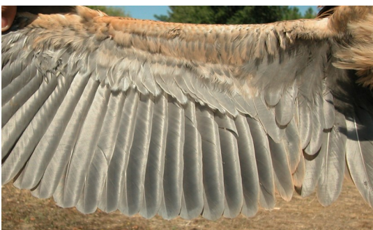
Garza imperial. Juvenil: diseño de secundarias (10-IX).