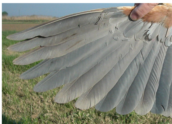
Garza imperial. Adulto. Hembra: diseño de primarias (22-IV).