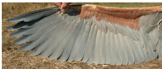
Garza imperial. Adulto. Macho: diseño del ala (10-IX).