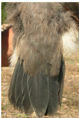
Garza imperial. Diseño de la cola: izquierda 2º año (); derecha juvenil (10-IX).