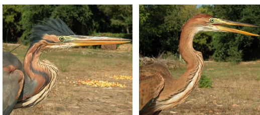
Garza imperial. Determinación de la edad. Diseño del cuello y cabeza: izquierda adulto; derecha juvenil.

Adulto con pileo negro; lados del cuello leonado marrón con una línea negra larga; con una línea negra desde la base del pico hasta la nuca; escapulares ornamentales y plumas del pecho largas; en primavera con plumas lanceoladas negras y largas en la nuca; partes superiores y coberteras del ala gris ceniza sin borde claro; todas las plumas de vuelo grisáceas.