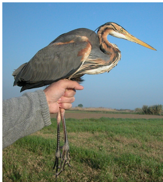
Garza imperial. Adulto. Hembra (22-IV).