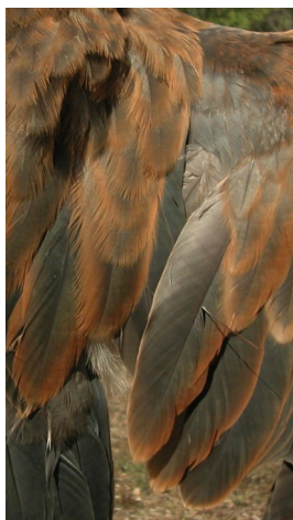
Garza imperial. Diseño de terciarias: izquierda 2º año (); derecha juvenil (10-IX).