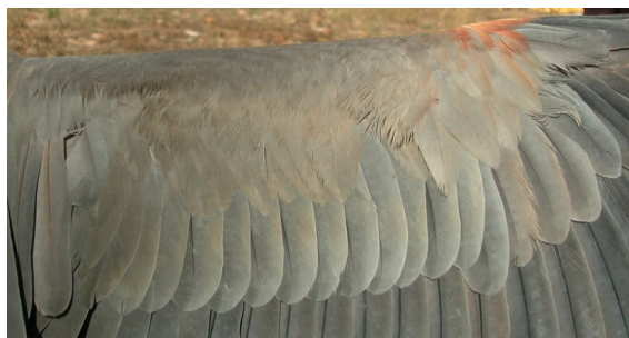
Garza imperial. Adulto. Macho: diseño de coberteras del ala (10-IX).