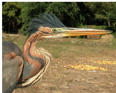
Garza imperial. Adulto. Diseño de la cabeza y plumas ornamentales del cuello: arriba macho (10-IX); abajo hembra (22-IV).