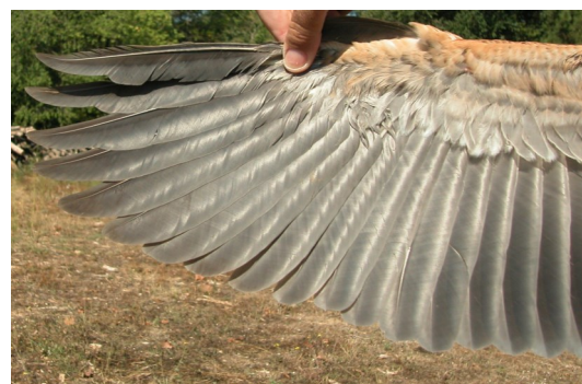
Garza imperial. Juvenil: diseño de primarias (10-IX).