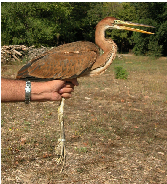
Garza imperial. Juvenil (10-IX).