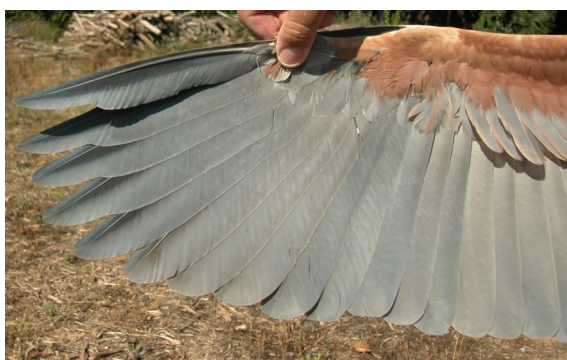
Garza imperial. Adulto. Macho: diseño de primarias (10-IX).