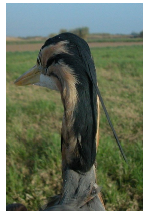
Garza imperial. Adulto. Diseño de la nuca: izquierda macho (10-IX); derecha hembra (22-IV).