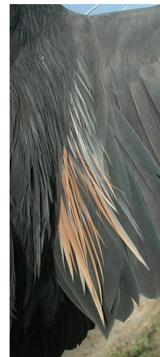
Garza imperial. Determinación del sexo. Diseño de escapulares: izquierda macho; derecha hembra.