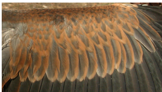
Garza imperial. Juvenil: diseño de coberteras del ala (10-IX).