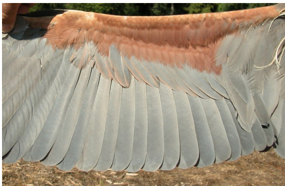
Garza imperial. Adulto. Macho: diseño de secundarias (10-IX).