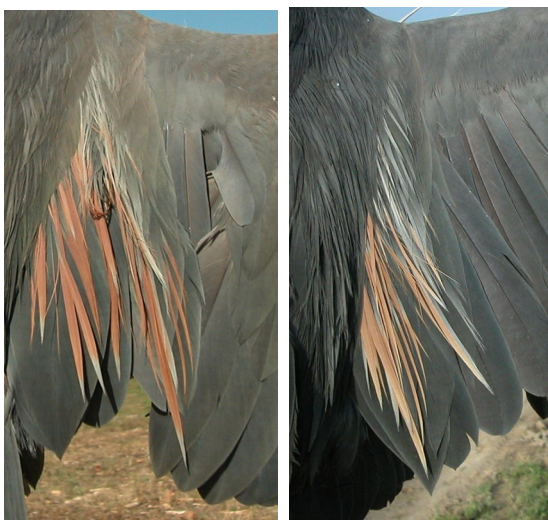
Garza imperial. Adulto. Diseño de terciarias: izquierda macho (10-IX); derecha hembra (22-IV).