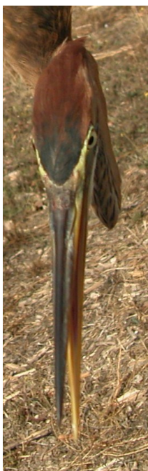
Garza imperial. Diseño del píleo: izquierda 2º año (); derecha juvenil (10-IX).