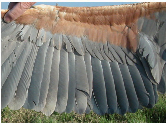
Garza imperial. Adulto. Hembra: diseño de secundarias (22-IV).