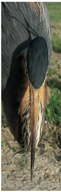
Garza imperial. Adulto. Diseño del píleo: izquierda macho (10-IX); derecha hembra (22-IV).