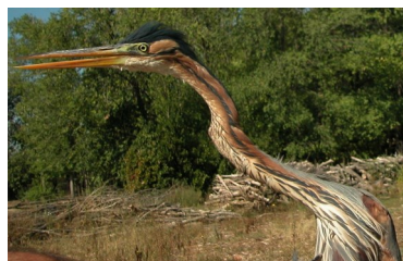
Garza imperial. Adulto. Diseño del pecho: arriba macho (10-IX); abajo hembra (22-IV).