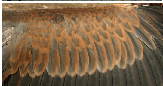
Garza imperial. Determinación de la edad. Diseño de las coberteras del ala: arriba adulto; abajo juvenil.