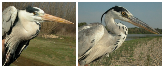
Garza real. Diseño del cuello y plumas ornamentales del pecho: izquierda adulto (12-III); derecha 2º año otoño (09-IX).