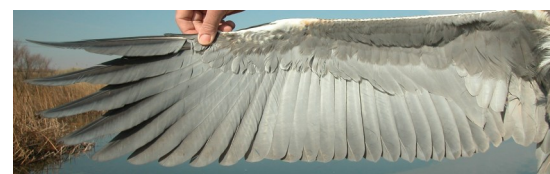
Garza real. 2º año primavera: diseño del ala (24-III).