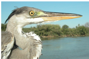
Garza real. Diseño de la cabeza y plumas ornamentales del pileo: arriba 2º año primavera (24-III); abajo juvenil (27-VII).