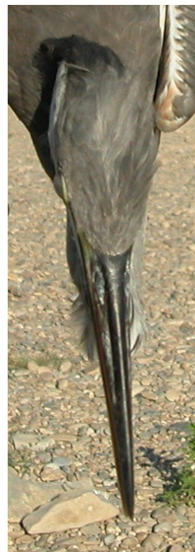
Garza real. Diseño de frente y pileo: izquierda 2º año primavera (24-III); derecha juvenil (27-VII).