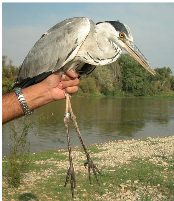
Garza real. 2º año otoño (10-IX)