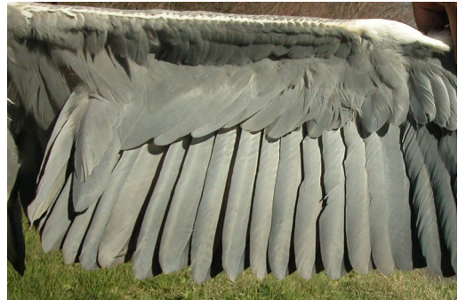
Garza real. Adulto: diseño de secundarias (12-III).