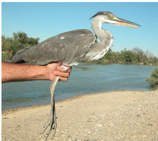
Garza real. Juvenil (27-VII).