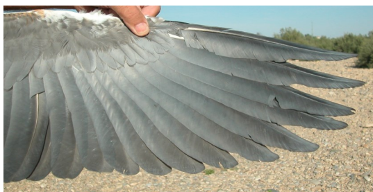
Garza real. Juvenil: diseño de primarias (27-VII).