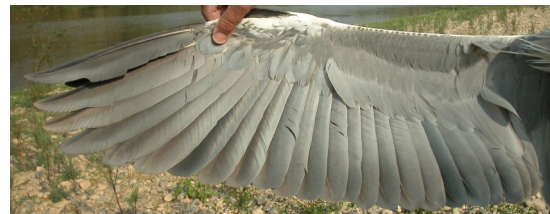
Garza real. 2º año otoño: diseño del ala (09-IX).