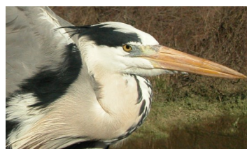
Garza real. Diseño del flanco: arriba adulto (12-III); abajo 2º año otoño (09-IX).