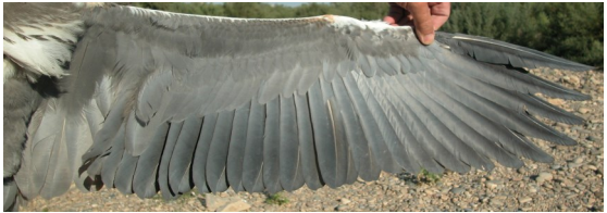
Garza real. Juvenil: diseño del ala (27-VII).