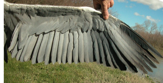
Garza real. Adulto: diseño del ala (12-III).