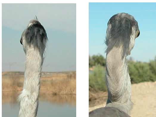
Garza real. Diseño de la nuca: izquierda 2º año primavera (24-III); derecha juvenil (27-VII).