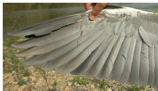
Garza real. 2º año otoño: diseño de primarias (09-IX).