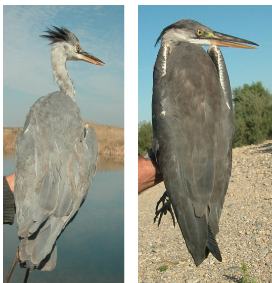
Garza real. Diseño del dorso: izquierda 2º año primavera (24-III); derecha juvenil (27-VII).