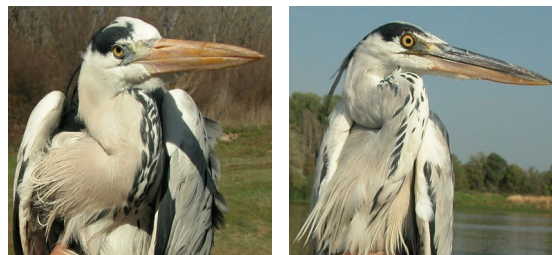
Garza real. Diseño del pecho: izquierda adulto (12-III); derecha 2º año otoño (09-IX).