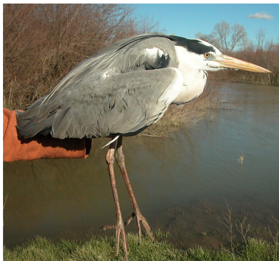
Garza real. Adulto (12-III).