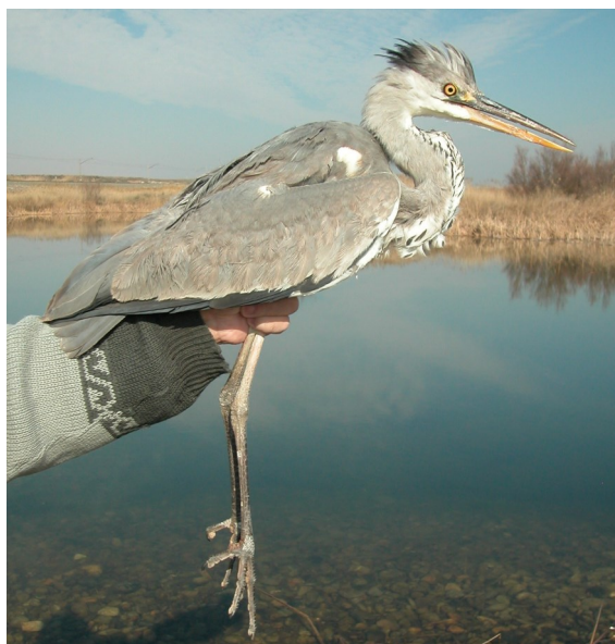
Garza real. 2º año primavera (24-III)