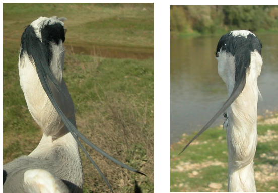
Garza real. Diseño de la nuca: izquierda adulto (12-III); derecha 2º año otoño (09-IX).