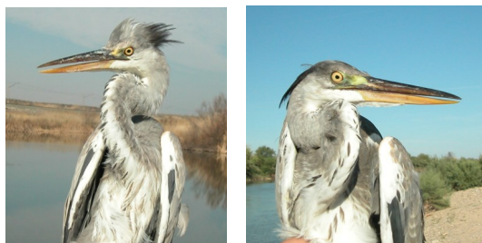
Garza real. Diseño del pecho: izquierda 2º año primavera (24-III) (); derecha juvenil (27-VII).