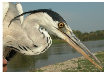
Garza real. Diseño de la cabeza y plumas ornamentales del pileo: arriba adulto (12-III); abajo 2º año otoño (09-IX).