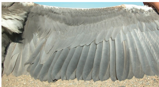
Garza real. Juvenil: diseño de secundarias (27-VII).