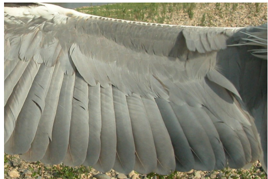
Garza real. 2º año otoño: diseño de secundarias (09-IX).