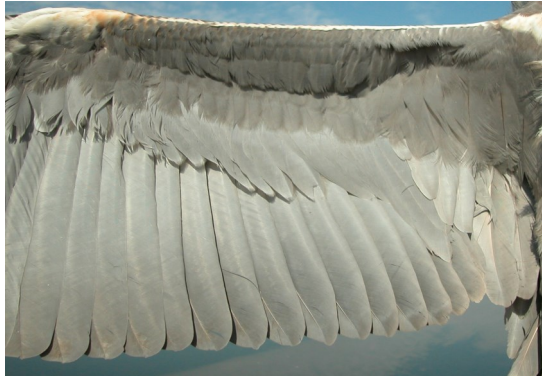
Garza real. 2º año primavera: diseño de secundarias (24-III).