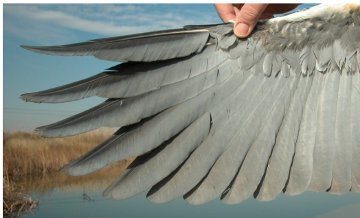
Garza real. 2º año primavera: diseño de primarias (24-III).