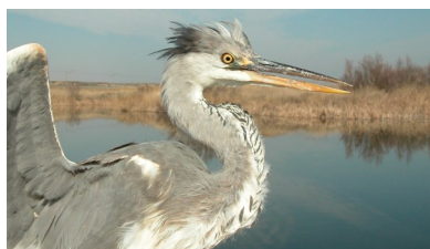
Garza real. Diseño del flanco: arriba 2º año primavera (24-III); abajo juvenil (27-VII).