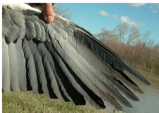
Garza real. Adulto: diseño de primarias (12-III).