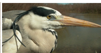
Garza real. Diseño del dorso y la cabeza.