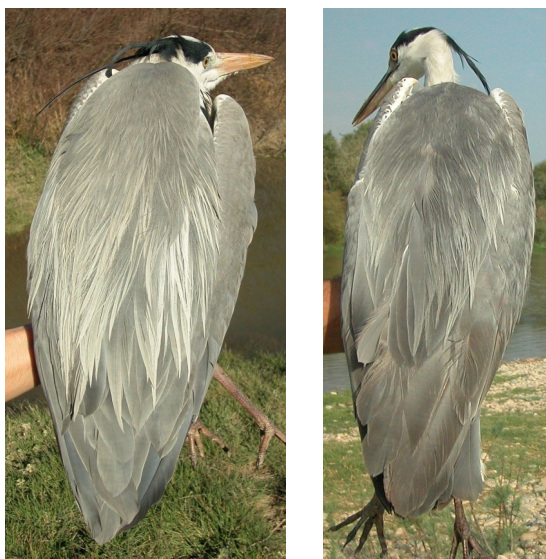
Garza real. Diseño del dorso: izquierda adulto (12-III); derecha 2º año otoño (09-IX).